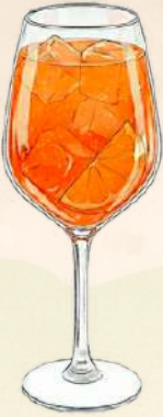
Aperol Spritz $190.00