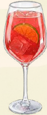
Campari Spritz $190.00