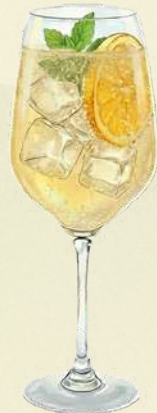
Hugo Spritz $210.00