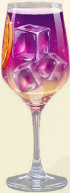
Limoncello Spritz $190.00