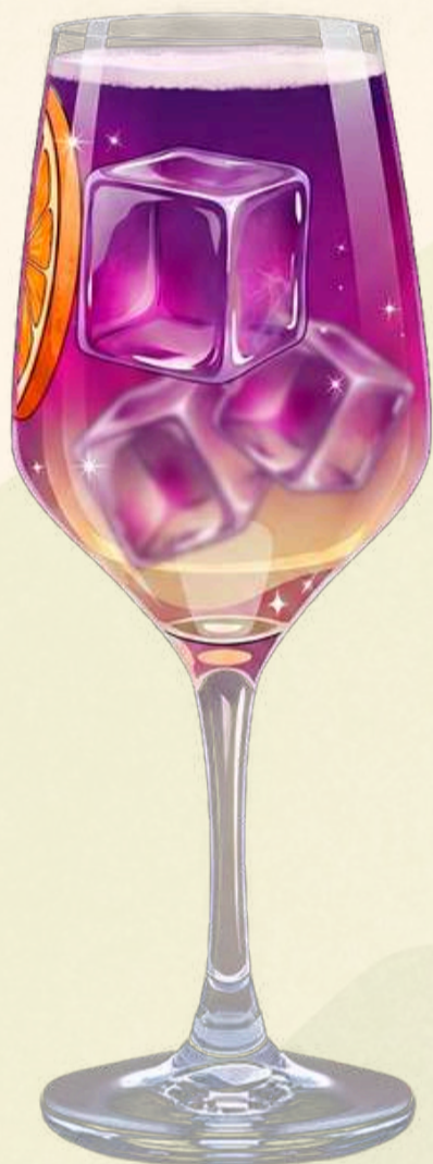
Limoncello Spritz $190.00