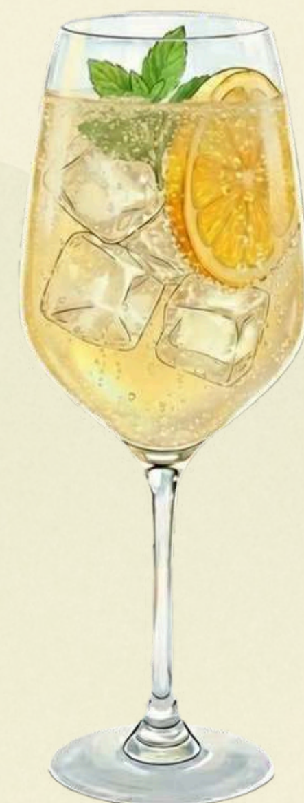
Hugo Spritz $210.00