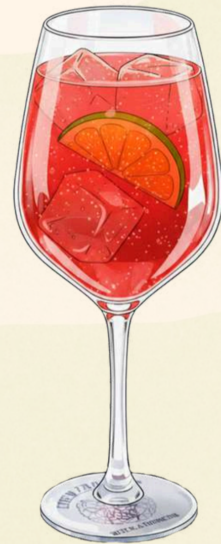
Campari Spritz $190.00