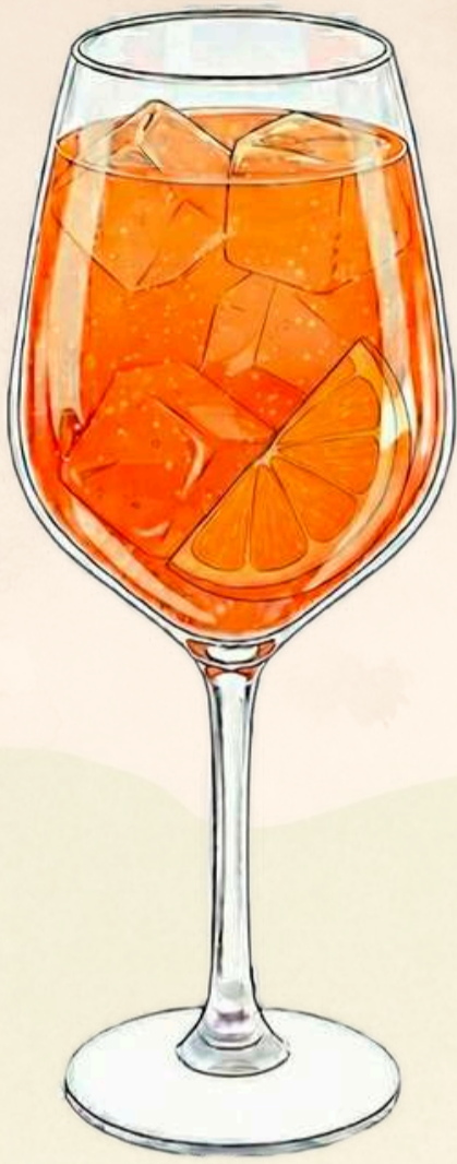
Aperol Spritz $190.00