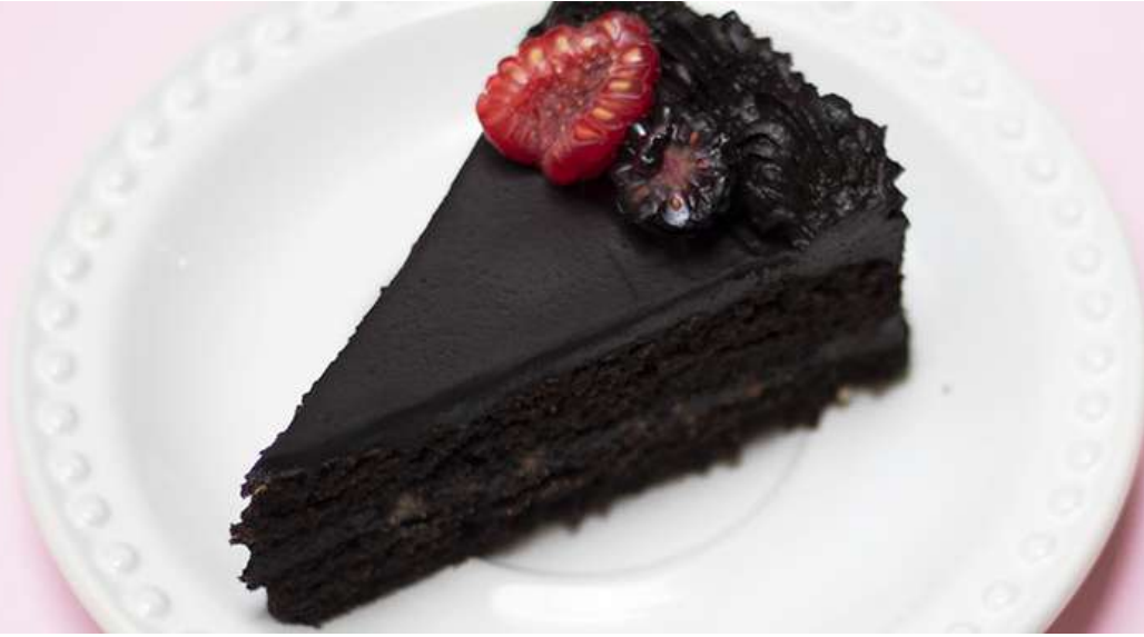
PASTEL DE AVELLANA Y CACAO