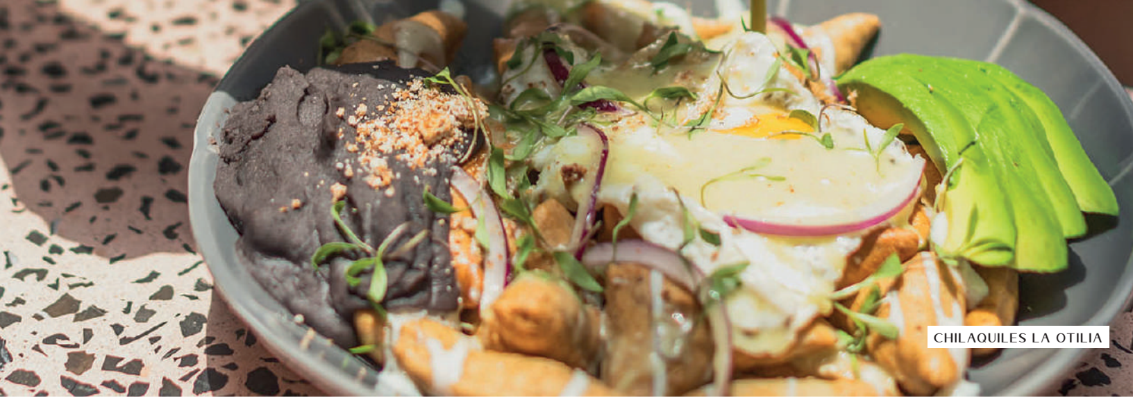
CHILAQUILES LA OTILIA