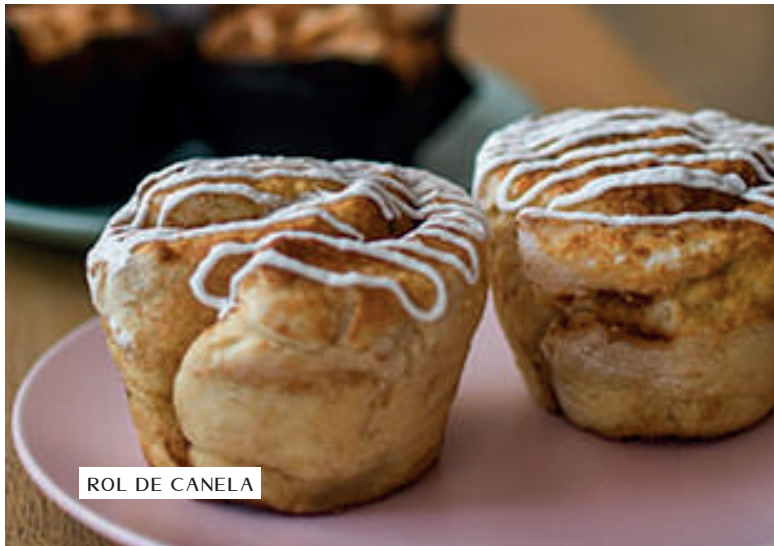
ROL DE CANELA