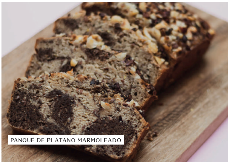
PANQUÉ DE PLÁTANO MARMOLEADO