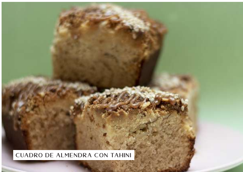
CUADRO DE ALMENDRA CON TAHINI