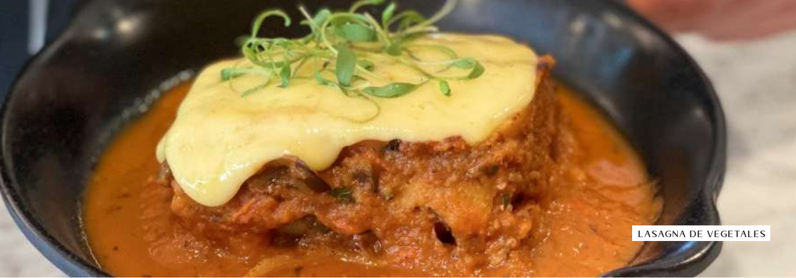
LASAGNA DE VEGETALES