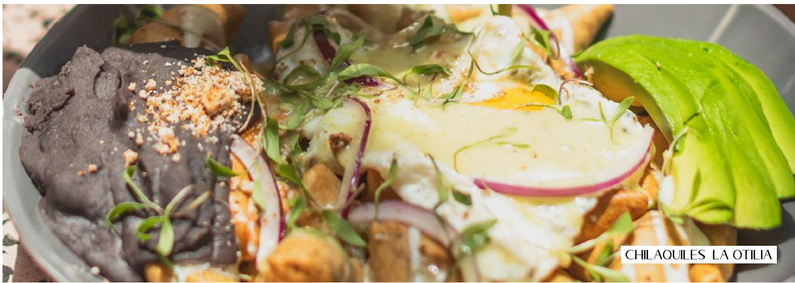
CHILAQUILES LA OTILIA