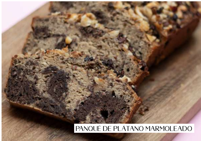
PANQUÉ DE PLÁTANO MARMOLEADO