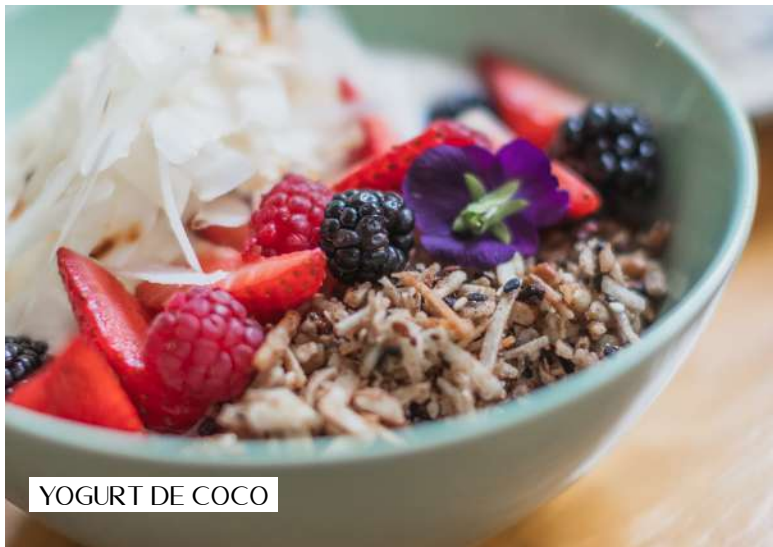
YOGURT DE COCO