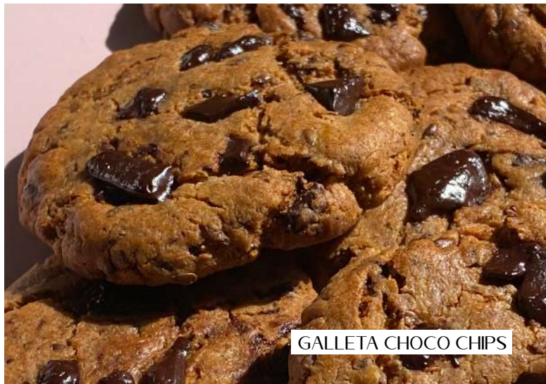
GALLETA CHOCO CHIPS