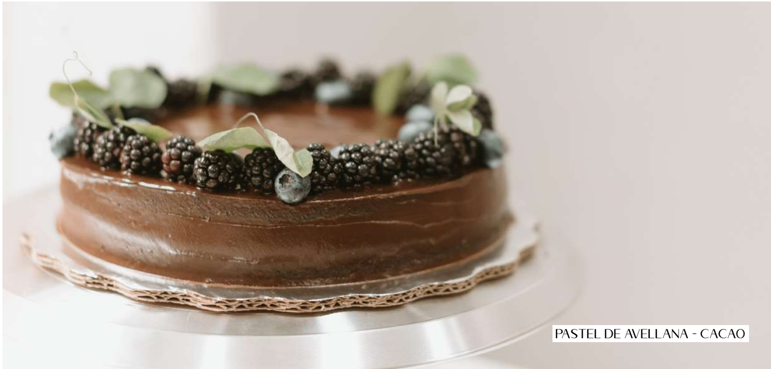
PASTEL DE AVELLANA - CACAO