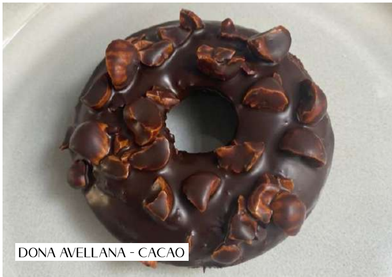
DONA AVELLANA - CACAO