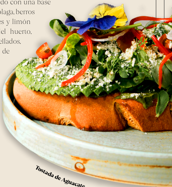
Tostada de Aguacate