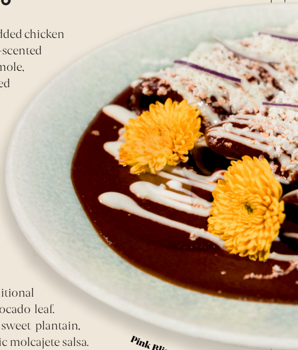
Pink Bliss Enchiladas