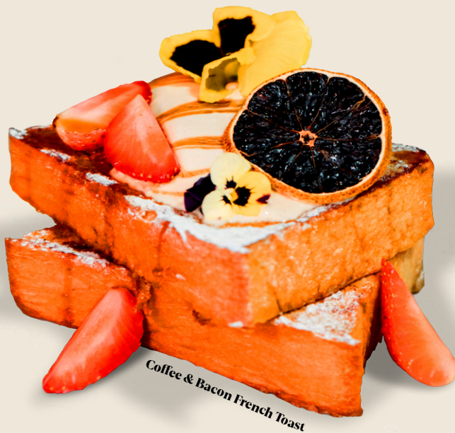
Coffee & Bacon French Toast