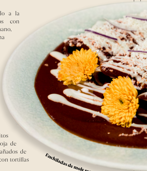
Enchiladas de mole rosa