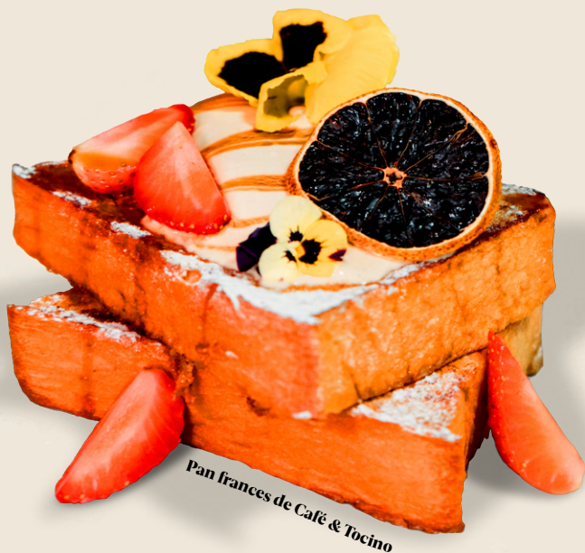
Pan francés de Café & Tocino