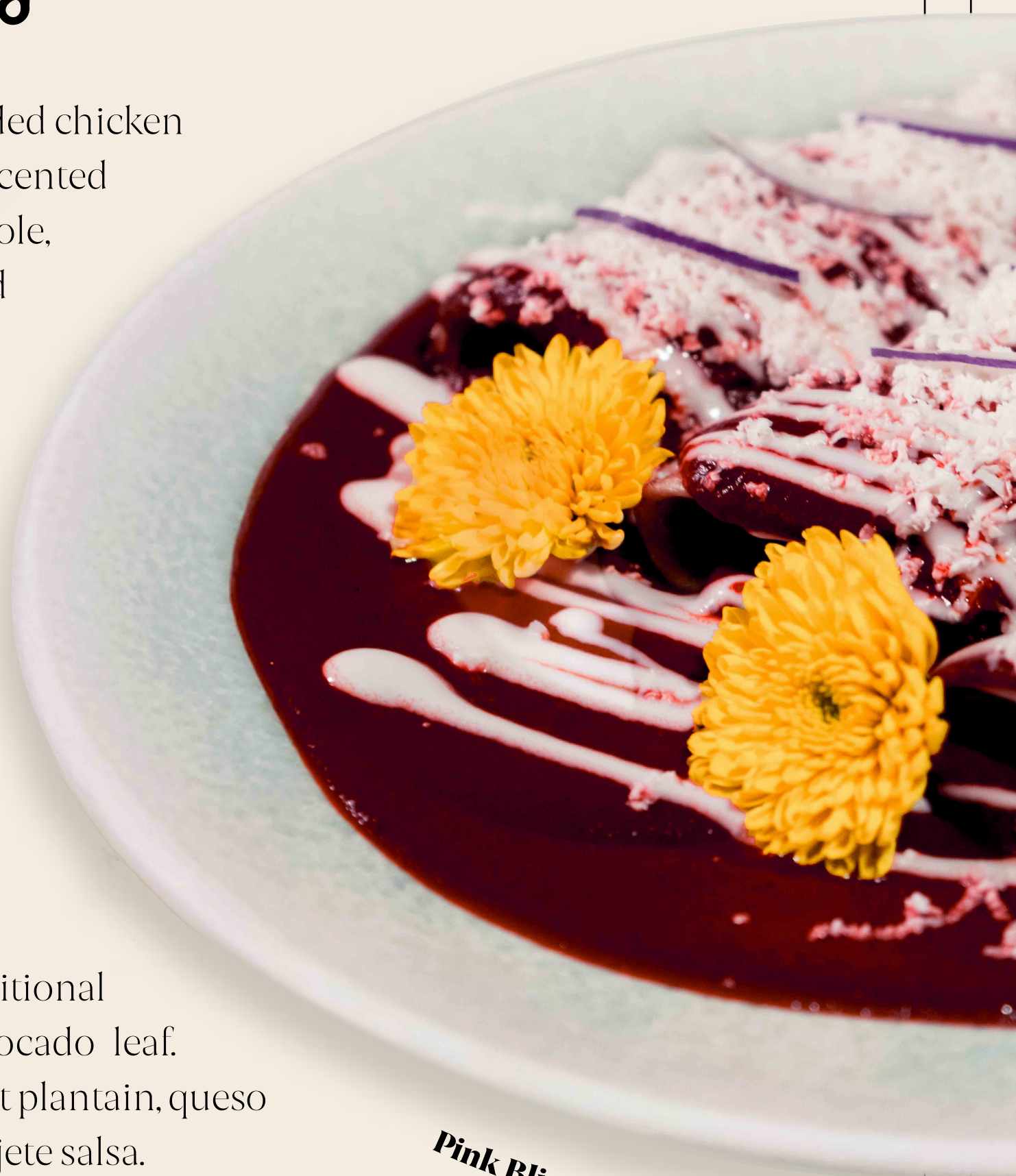
Pink Bliss Enchiladas