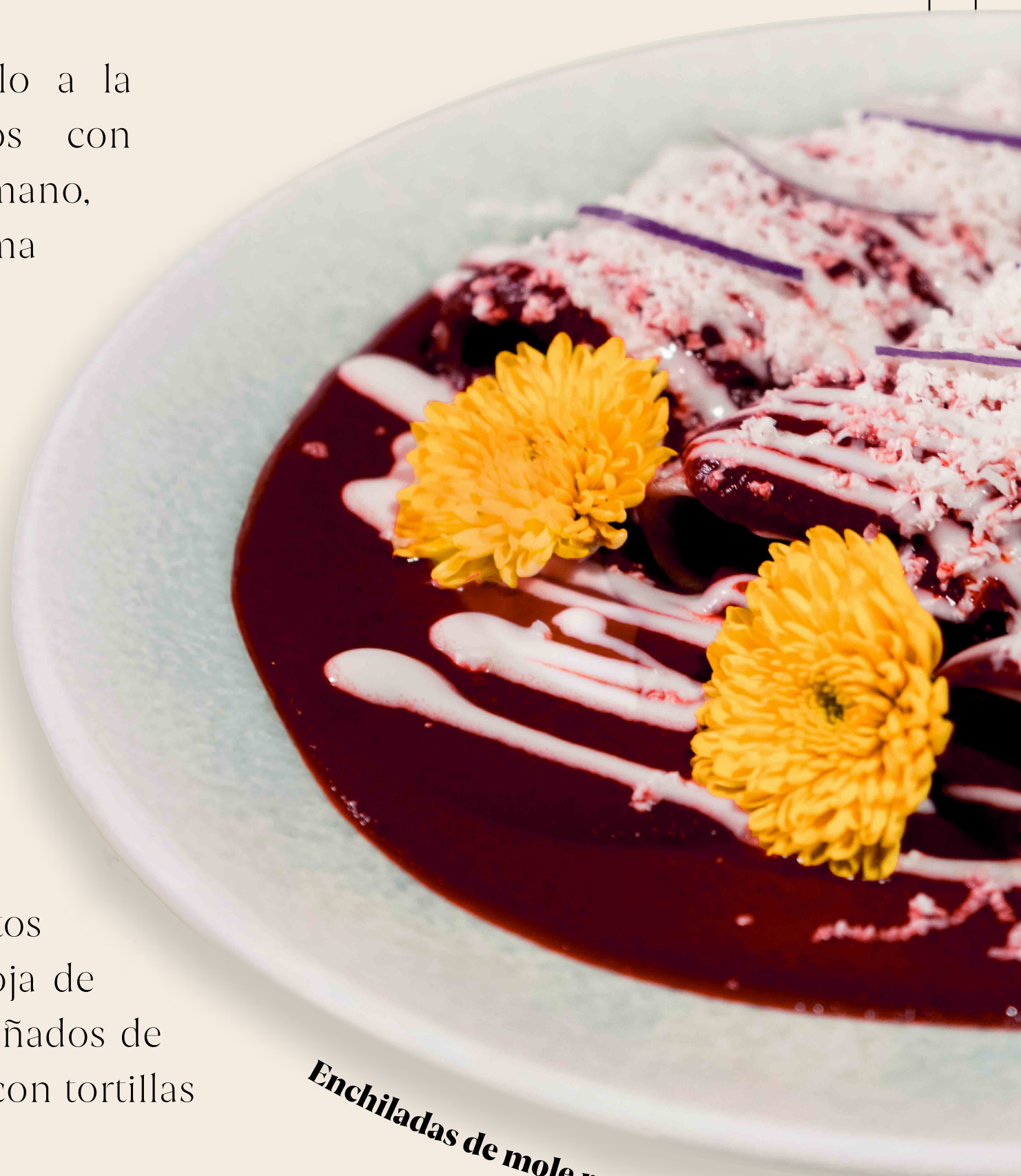
Enchiladas de mole rosa