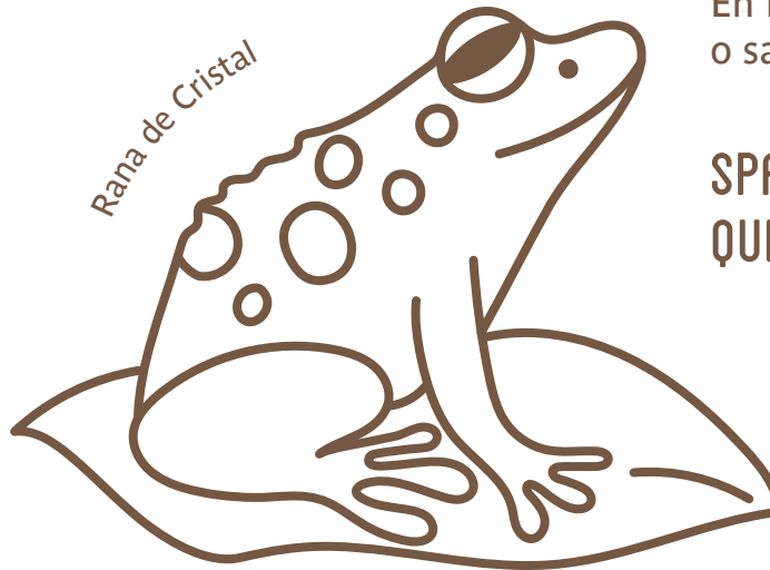
Rana de Cristal

Deditos de pollo empanizados con papas fritas, mayonesa y salsa de tomate.