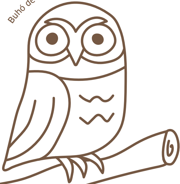
Buho de Anteojos