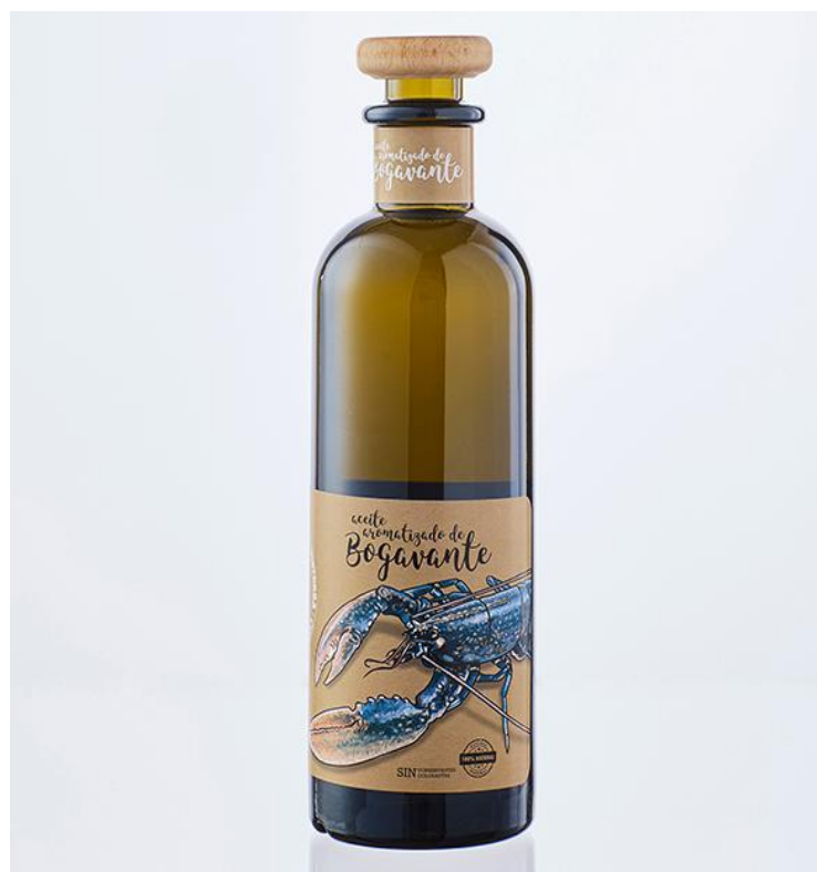
Aceite infundado de bogavante Precio: 22,00€ ¡AGOTADO!