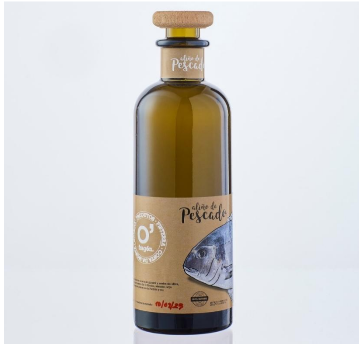
Aliño de pescado Precio: 9,00€