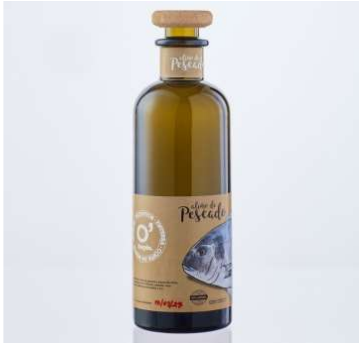
Aliño de pescado Precio: 9,00€