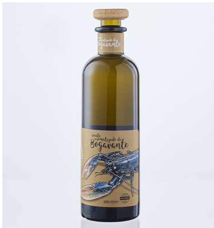
Aceite infusionado de bogavante Precio: 22,00€ ¡AGOTADO!