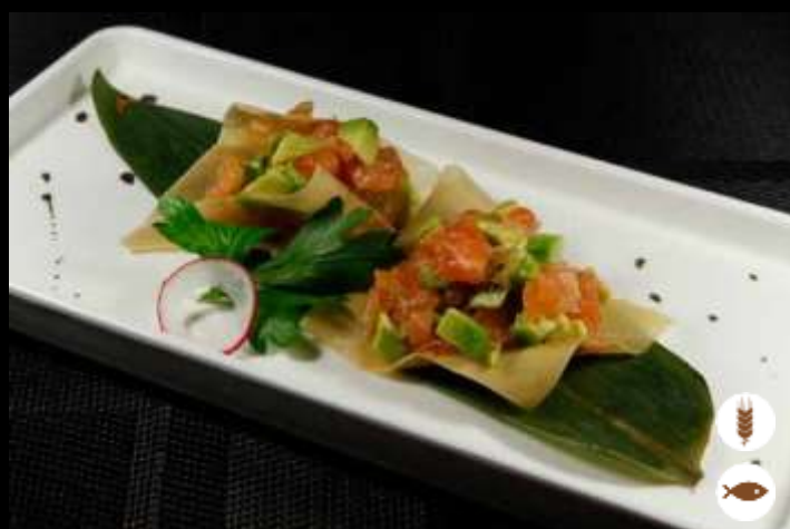
82 MILLE FOGLIE SALMONE