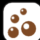
AMIDRICE SOLFORS A A SOLFITI

In caso di intolleranze e/o allergie alimentari rivolgersi al personale