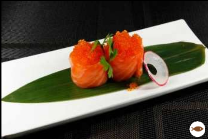
67 GUNKAN OUT TOBIKO SALMONE € 6,00