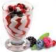
Bicchieri in vetro Yogurt con Frutti di Bosco