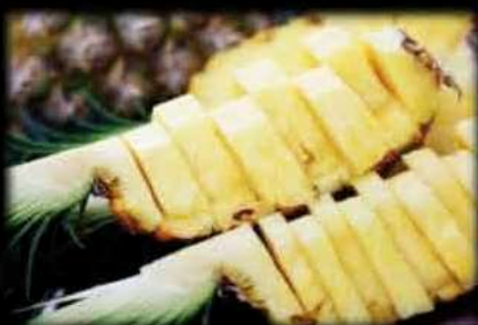
Ananas fresco €5,00