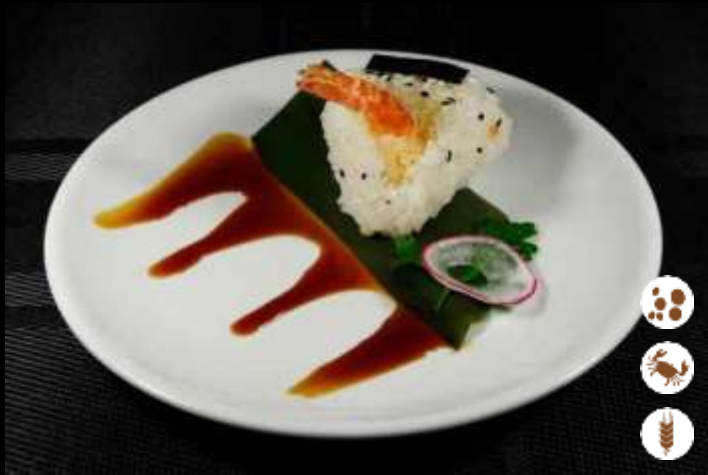
36 ONIGIRI EBITEN ❄️

polpetta di riso con gambero fritto e salsa teriyaki