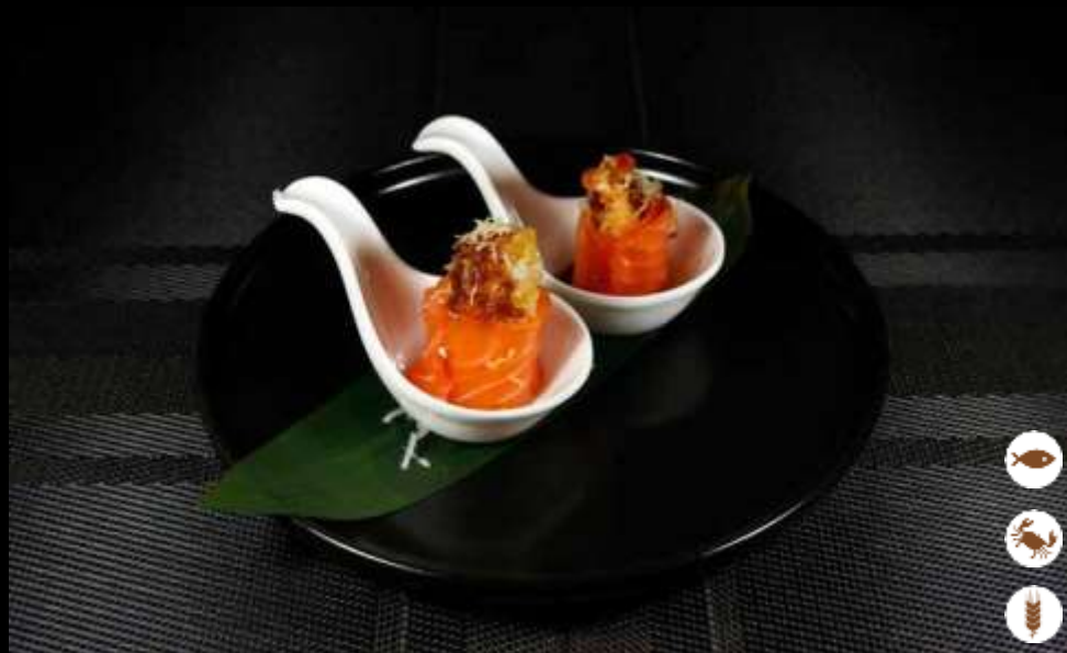
69 GUNKAN OUT EBI ordinabile 1 volta