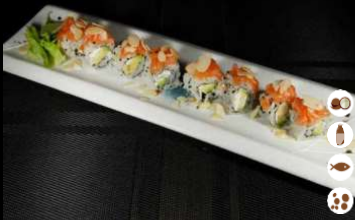
109 URA ROCK'N'ROLL € 9,00 tartare di salmonne, avocado, philadelphia escaglie di mandorle