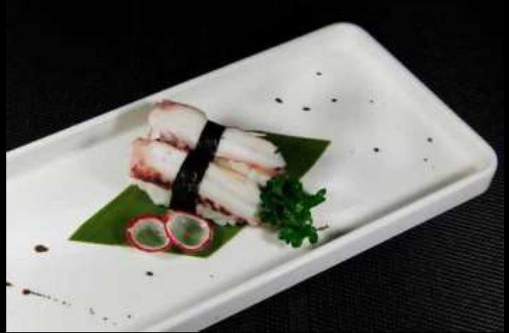
56 NIGIRI POLPO ❄️