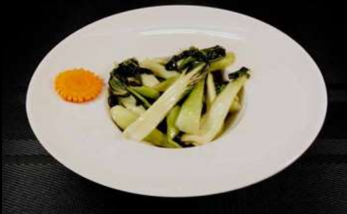
166 PAK CHOI 🌿