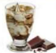
Bicchieri in vetro variegato al Cacao