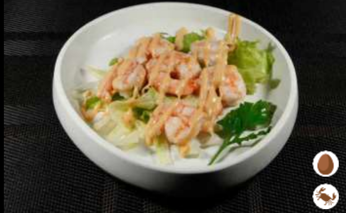
10 GAMBERI IN SALSA COCKTAIL ❄️ 🍤