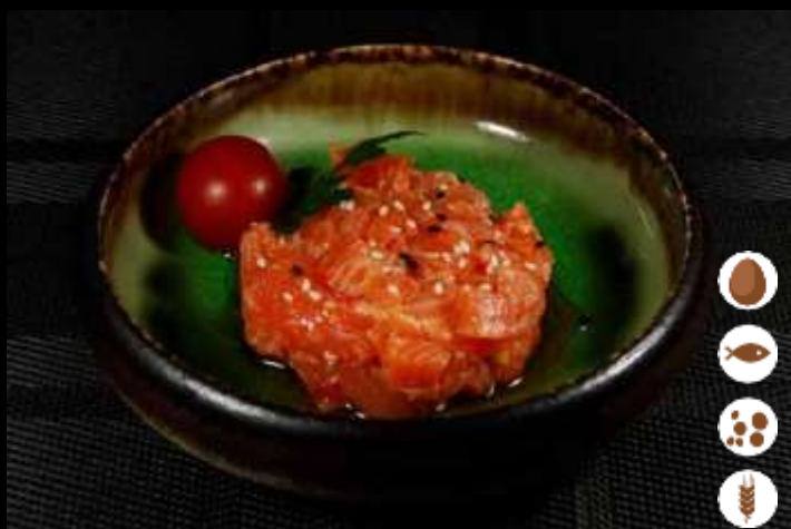
79 TARTARE SPICY SALMONE