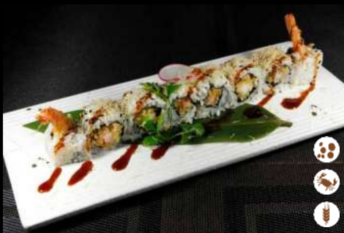
93 URA EBITEN ❄️

tonno cotto, cetrioli, philadelphia, gamberi cotti