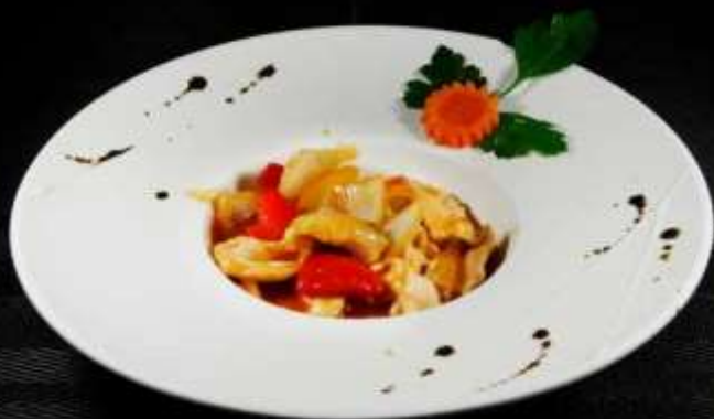
172 POLLO IN SALSA PICCANTE ❄️ 🌶️ € 6,50