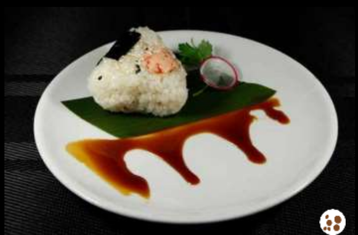
37 ONIGIRI MIURA

polpetta di riso con salmone cotto e philadelphia