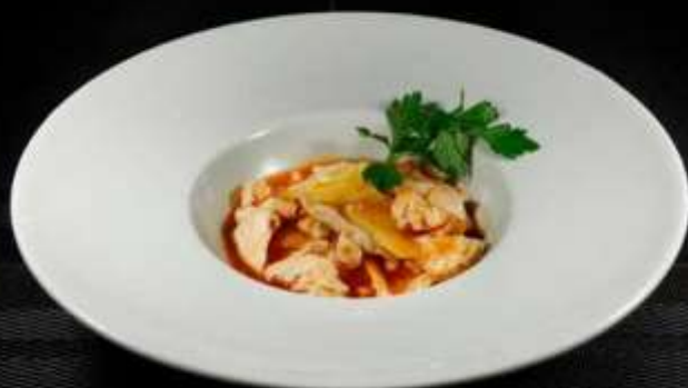
176 POLLO IN SALSA AGRODOLCE ❄️ € 6,50