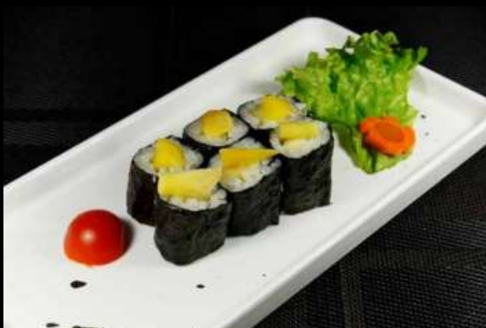
28 HOSOMAKI MANGO