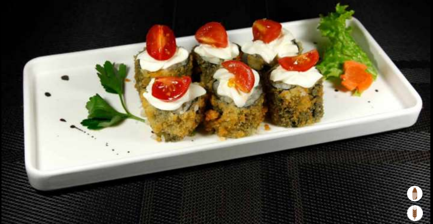
32 HOSOMAKI SPECIAL POMODORO € 5,50 philadelphia, pomodoro