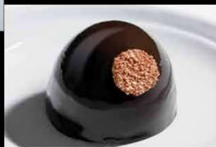
Venere Nera €7,00