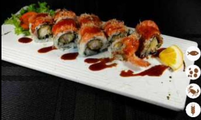
111 URA TIGER ROLL € 10,00 tempura di gamberi, salmone, salsa teriyaki