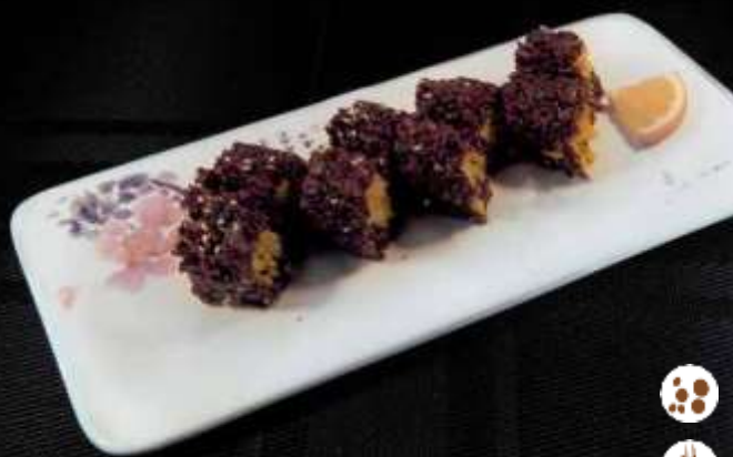
103 URA BLACK FANTASY € 7,50 riso venere, alghe di soia, tempura di verdure e avocado