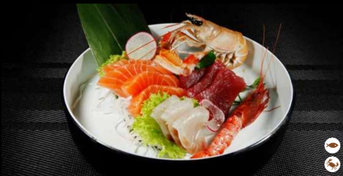
76 SASHIMI MISTO SPECIALE ordinabile 1 volta