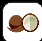
FRUTTA A GUSCIO