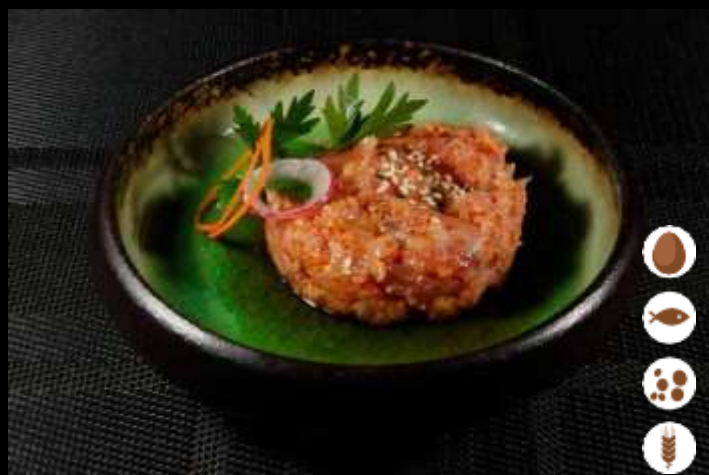
80 TARTARE SPICY TONNO