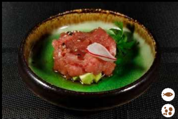
78 TARTARE TONNO