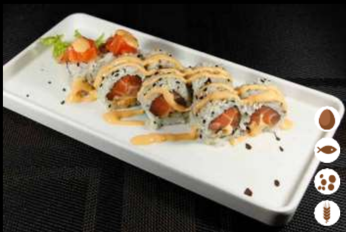
99 URA SPICY SALMONE 🌶️ € 7,50 salmone, maionese piccante