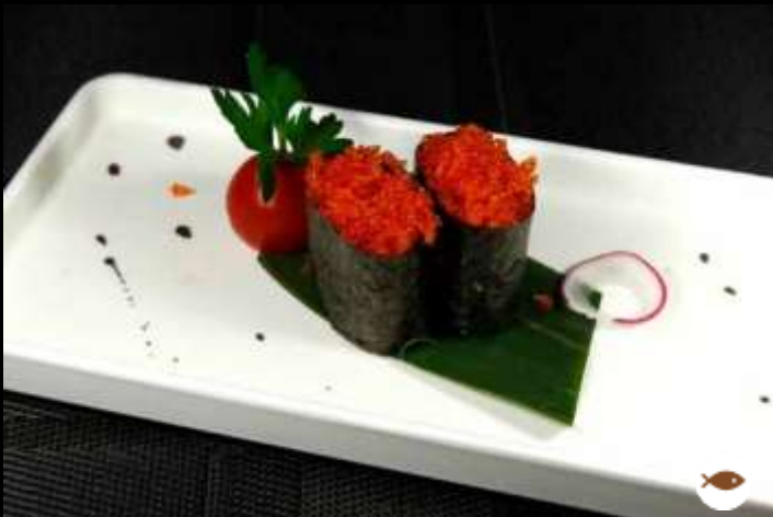
63 GUNKAN TOBIKO ❄️