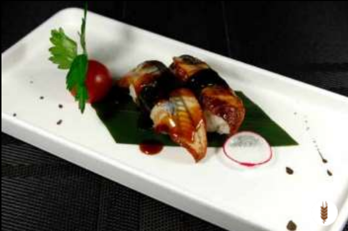
47 NIGIRI UNAGI ❄️