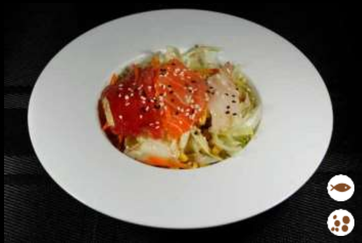
08 SASHIMI SALAD 🐟 insalata mista con pesce crudo misto, sesamo e salsa sesamo