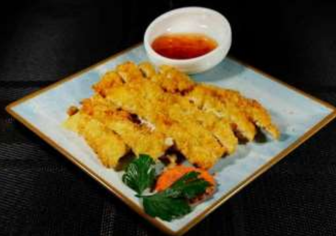
162 COTOLETTA DI POLLO FRITTO