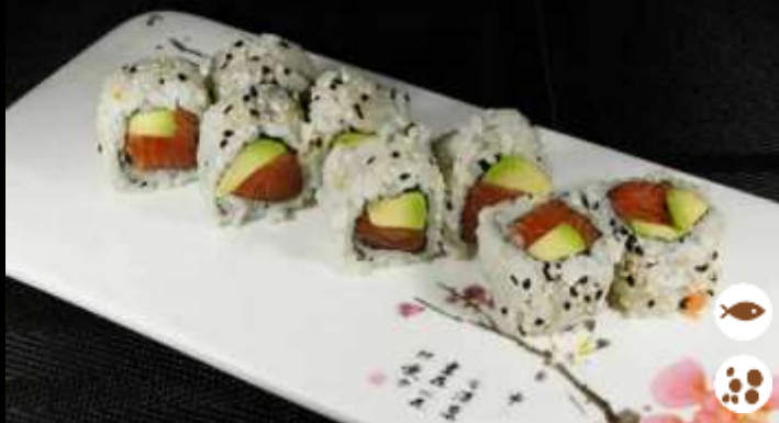
90 URA SAKE