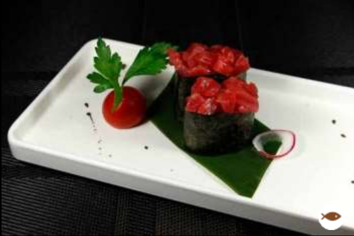
61 GUNKAN TONNO