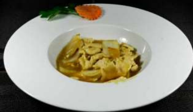
173 POLLO AL CURRY ❄️