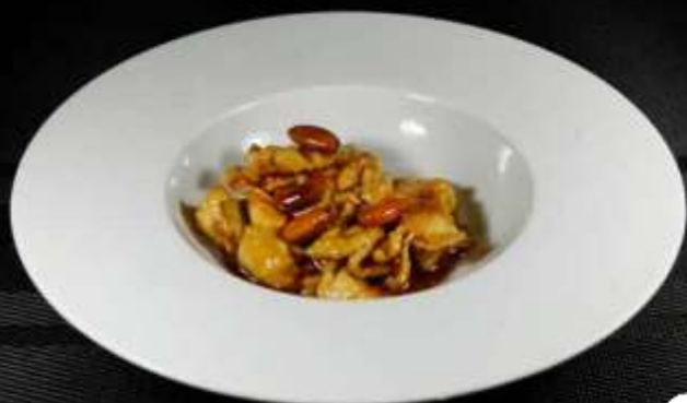
174 POLLO CON MANDORLE ❄️