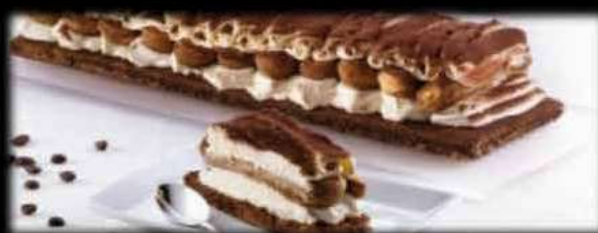
Tiramisù con savoiardi €5,00