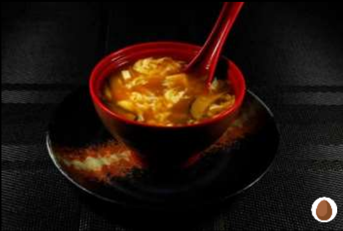
129 ZUPPA AGRO PICCANTE 🌶️ tofu, funghi, uova, bambu e piselli

zuppa di pesce: salmone, surimi di granchio e gamberi