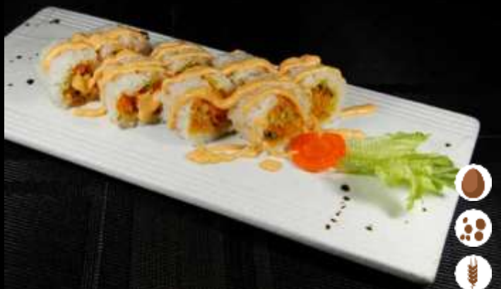
107 URA HOT SPICY 🌶️ € 8,00 tempura di verdure, sfoglia di tofu e maionese piccante