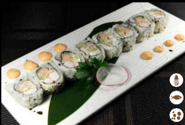
92 URA GIO TUNA

salmon, avocado, philadelphia e teriyaki