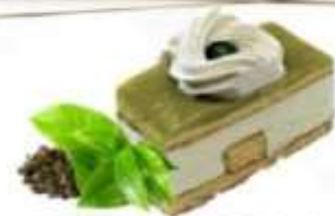
Trancio orientale al The Verde