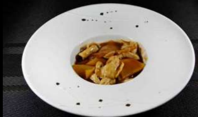
171 POLLO CON PATATE ❄️