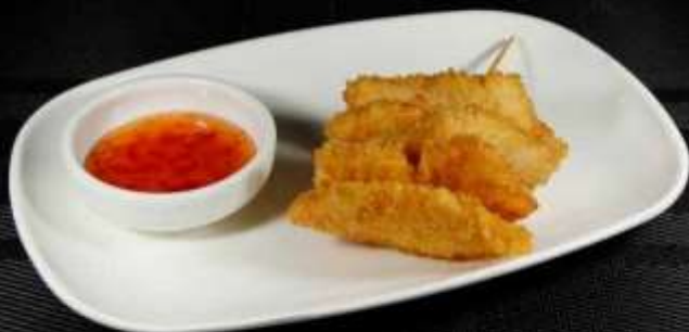
159 TEMPURA SALMONE 🐟