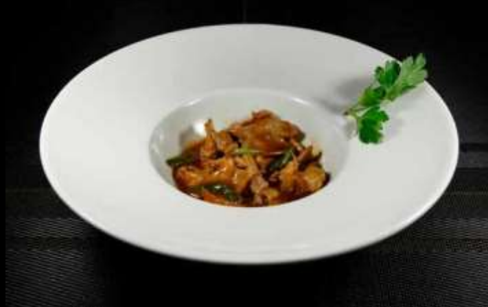
179 VITELLO CON ZENZERO E CIPOLLOTTO ❄️