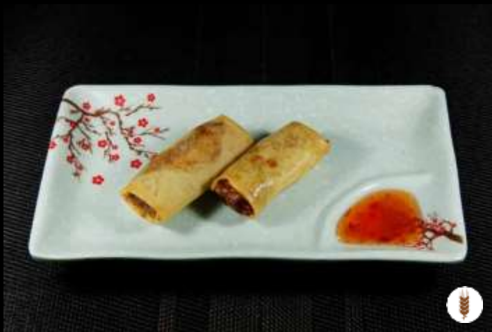
03 INVOLTINI DI CARNE ❄️ involtini di maiale