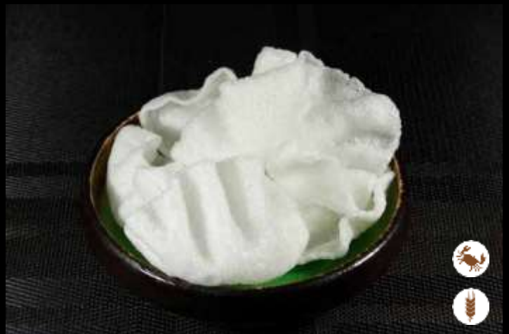
06 NUVOLE DI DRAGO farina di gamberi