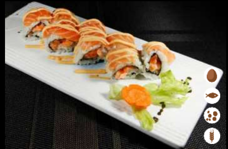
114 SPICY SALMON ROLL € 9,00 tartare di salmone e maionese piccante