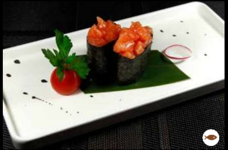
60 GUNKAN SALMONE