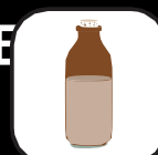
LATTE CONTENENT E LATTOSIO