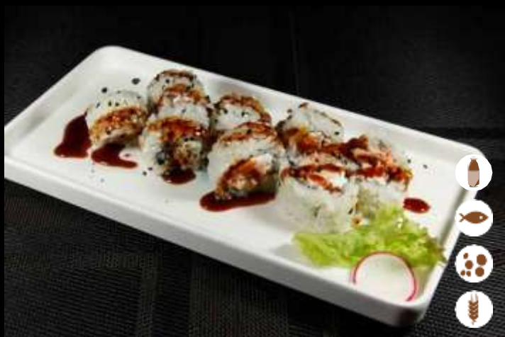
98 URA MIURA € 7,00 salmone cotto, philadelphia, salsa teriyaki