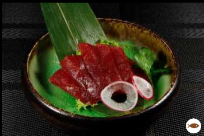
74 SASHIMI TONNO 5 pz ordinabile 1 volta