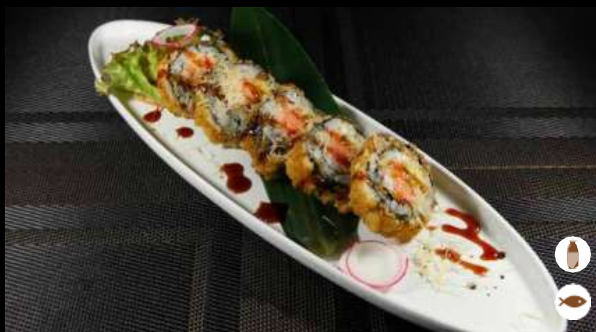
125 FUTO FRITTO

salmon, tonno, cetrioli, avocado e philadelphia