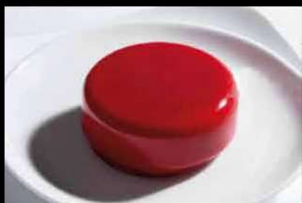
Rubino Cheesecake €7,00