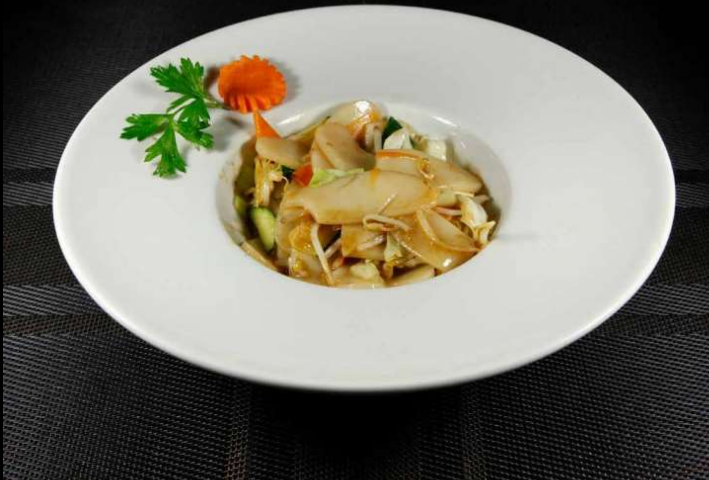
146 GNOCCHI DI RISO CON VERDURE 🌿