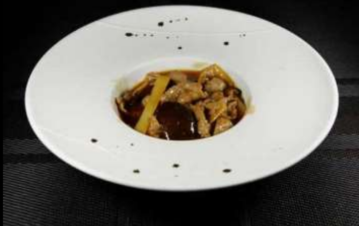
178 VITELLO FUNGHI BAMBU ❄️