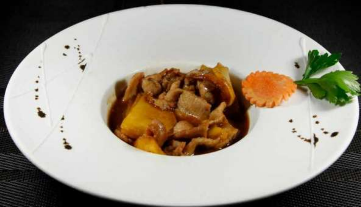
180 VITELLO CON PATATE ❄️