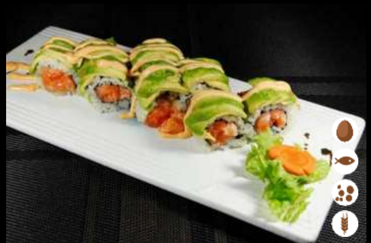
116 URA SPICY AVOCADO € 9,00 tartare salmone, avocado e maionese piccante