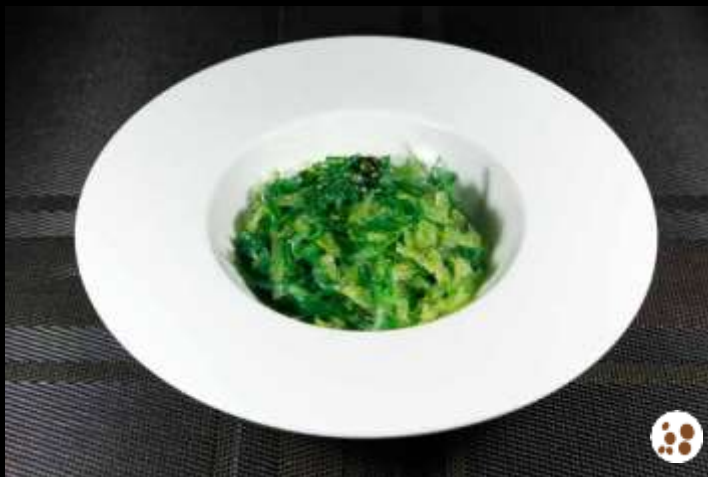
07 GOMA WAKAME ❄️ 🌿 misto di alghe giapponesi