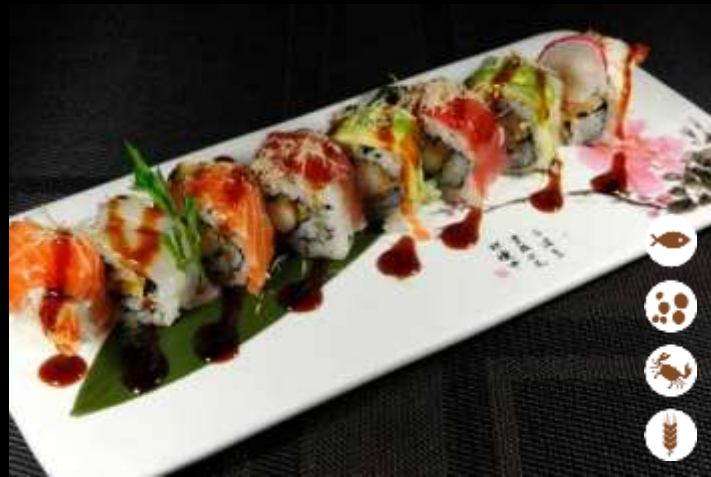
113 URA RAINBOW € 10,00 gamberoni in tempura, avocado, pesce misto e teriyaki