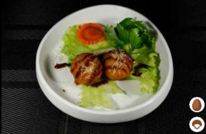
11 TAKOYAKI ❄️ polpette di polpo, salsa teriyaki e kataifi