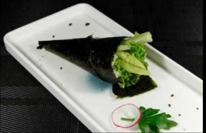
46 TEMAKI VEGETARIANO 🌿