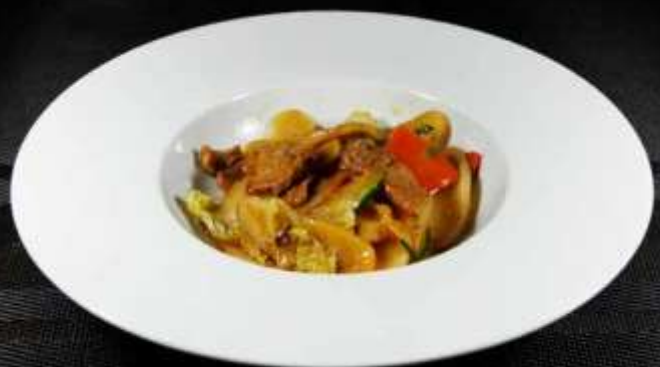
145 GNOCCHI DI RISO, VITELLO E VERDURE € 6,00