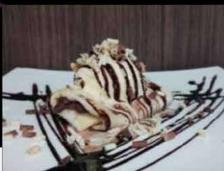
Crepes di soia con gelato €6,00