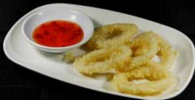
158 TEMPURA CALAMARI ❄️