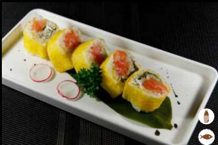
123 FUTO FANTASY