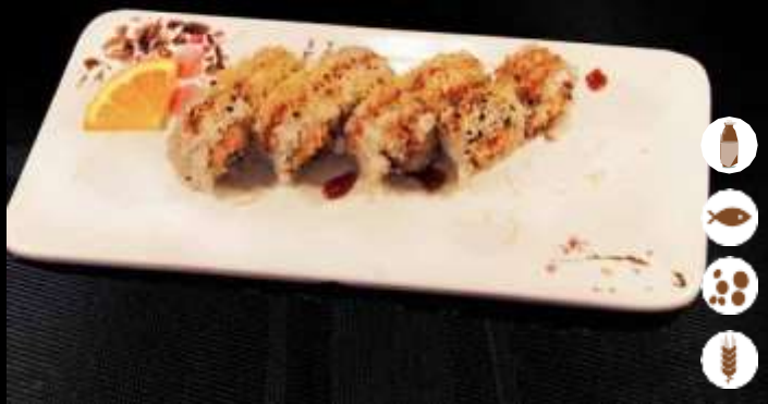
108 URA ZAKANA € 7,50 salmonne fritto, philadelphia, teriyaki e kataifi