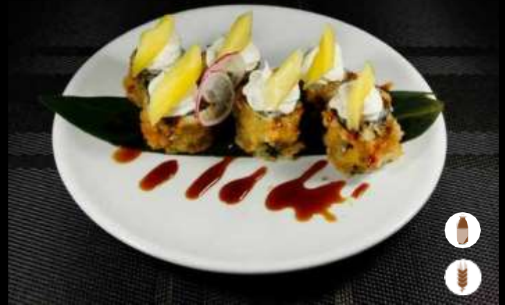
31 HOSOMAKI SPECIAL MANGO € 5,50 philadelphia, mango e teriyaki