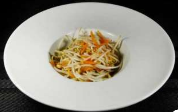
165 GERMOGLI DI SOIA 🌿

carote, zucchini, verze e germogli di soia