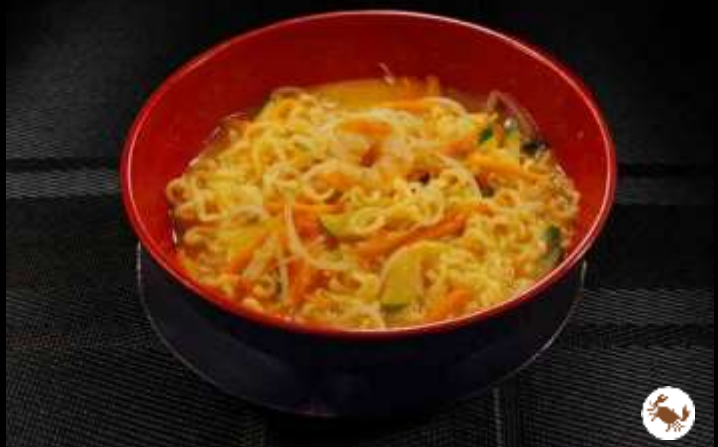
144 NOODLES gamberi e verdure