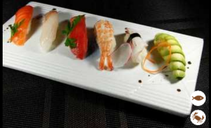
58 NIGIRI MIX 6 pz