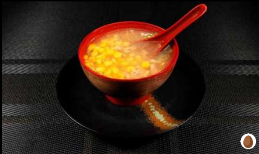
131 ZUPPA MAIS CON POLLO mais, pollo e uova