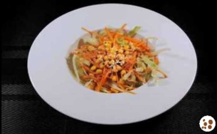
09 INSALATA MISTA 🌿 ice berg, carote, maïs, sesamo e salsa sesamo