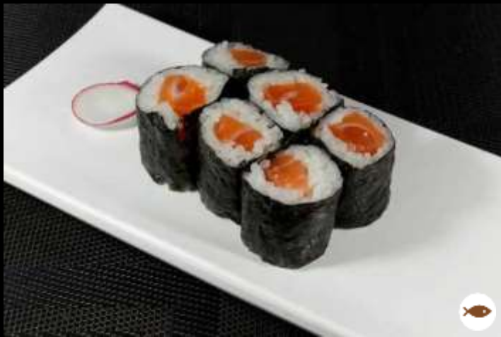
24 HOSOMAKI SALMONE