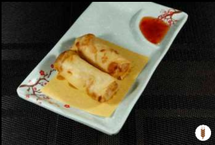
01 INVOLTINI PRIMAVERA ❄️ 🌿 verdure