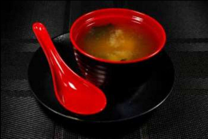
127 MISO SOUP 🌿 tofu e alghe