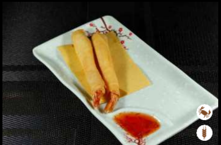
02 HARUMAKI ❄️ involtini di gamberi