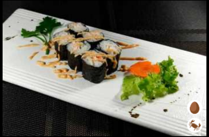
29 HOSOMAKI COCKTAIL