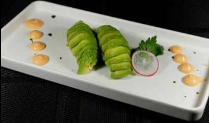
57 NIGIRI AVOCADO 🥑