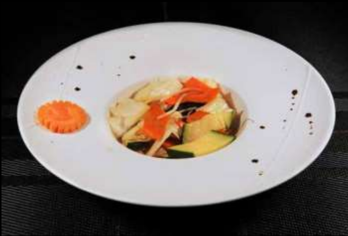
164 VERDURE MISTE 🌿