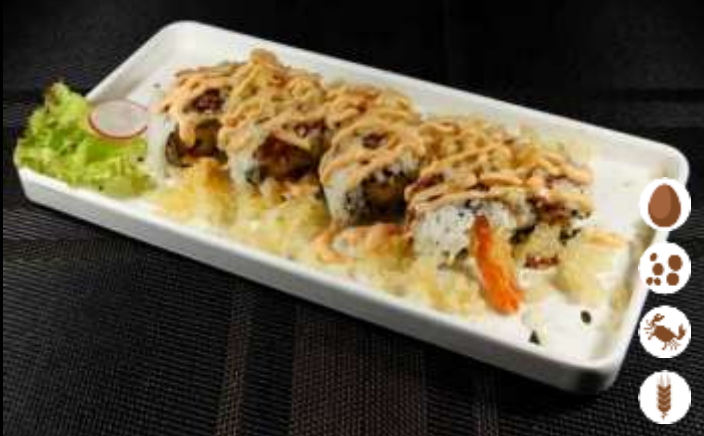
110 URA EBI COCKTAIL € 10,00 tempura gamberi, polvere di tempura, teriyaki e saba cocktail