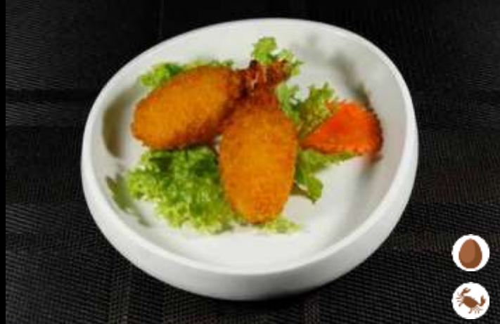
12 CHELE DI GRANCHIO ❄️ 🍤