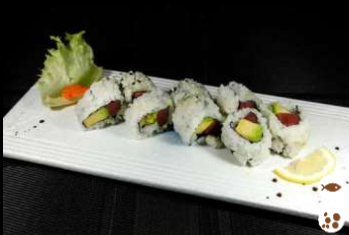
95 URA M AGURO