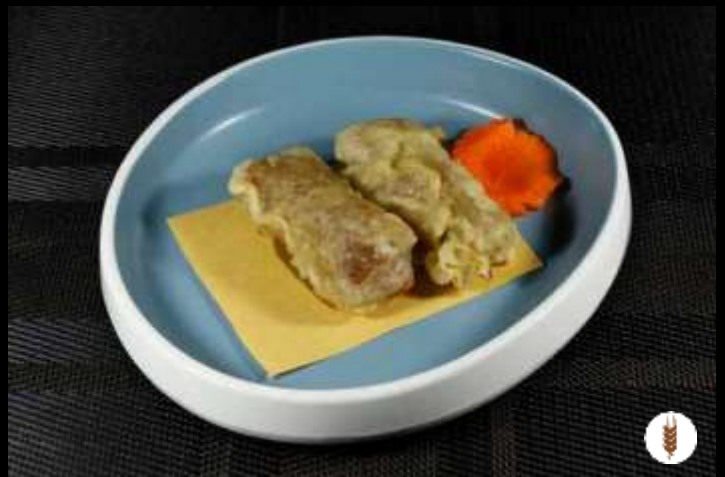
04 INVOLTINI VIETNAMITA ❄️ spaghetti di soia, carne di maiale e verdure miste