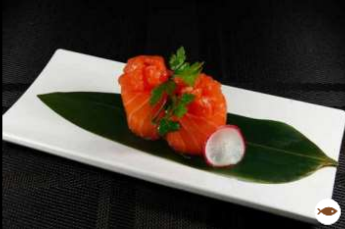
65 GUNKAN OUT SALMONE