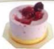
Tortino Semifreddo Cheesecake