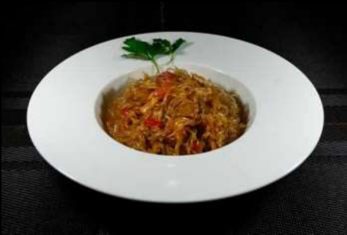
140 SPAGHETTI DI SOIA, POLLO PICCANTE E VERDURE € 5,50