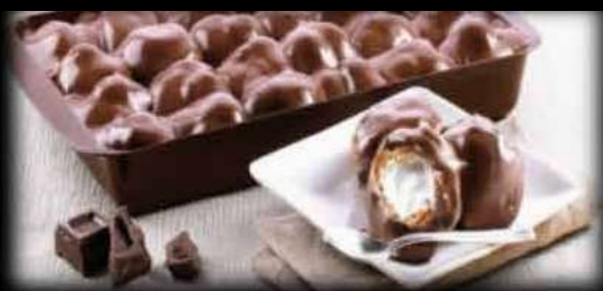
Profitterol nero/bianco €5,00