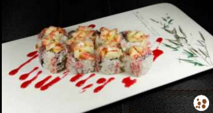
102 URA FRUIT 🌿 ananas e salsa fragole