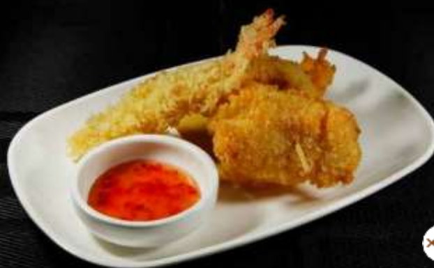
160 PESCE MISTO FRITTO ❄️ 🐟 🦑