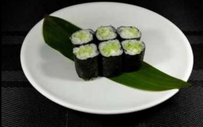
26 HOSOMAKI CETRIOLI