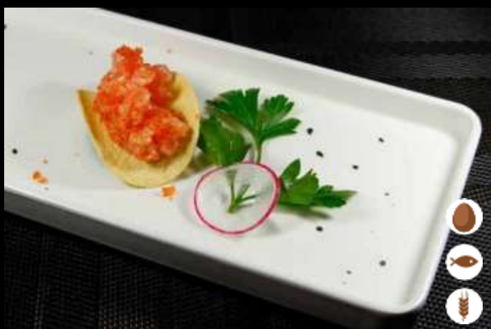
81 CHIPS SPICY SALMONE