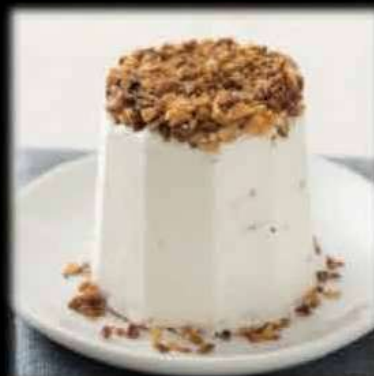
Semifreddo al Torroncino/caffè €5,00