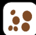
SEMI DI SESAMO