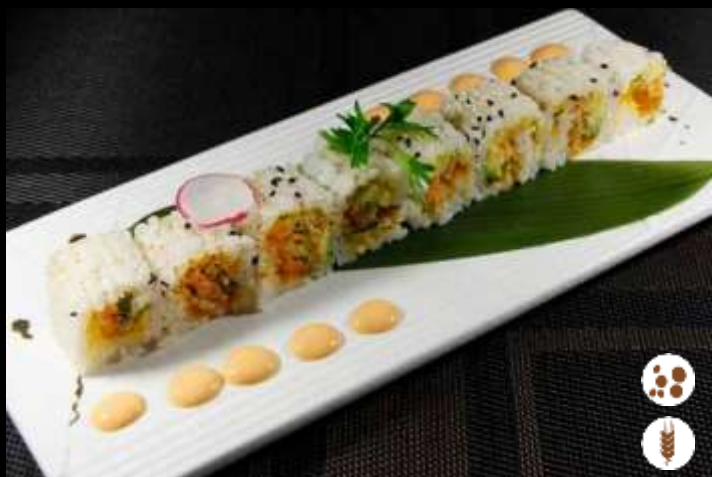
96 URA GREEN FANTASY 🌿 € 7,00 alga di soia, tempura di verdure e avocado