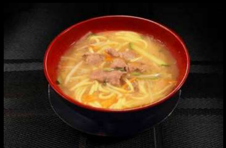
143 RAMEN IN BRODO CON MANZO € 6,50