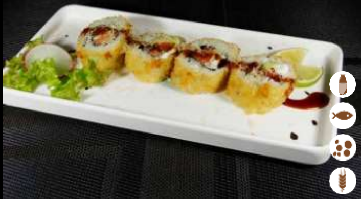
91 URA FRITTO