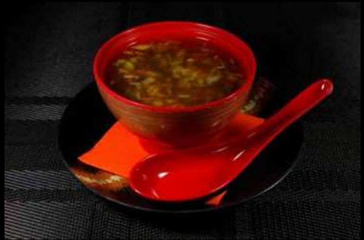
130 VEGETABLE SOUP 🌿