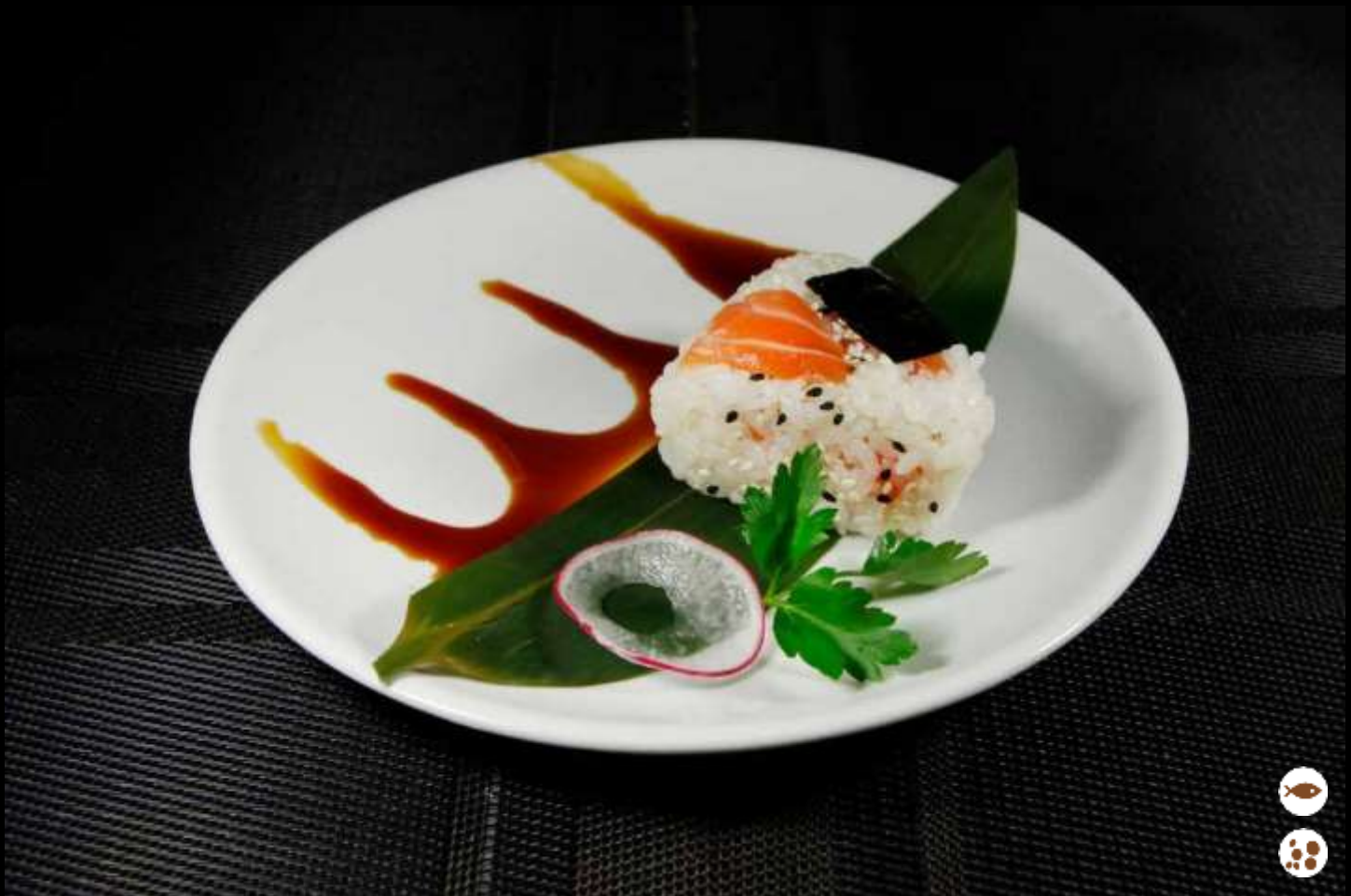
38 ONIGIRI SALMONE polpetta di riso con salmone crudo