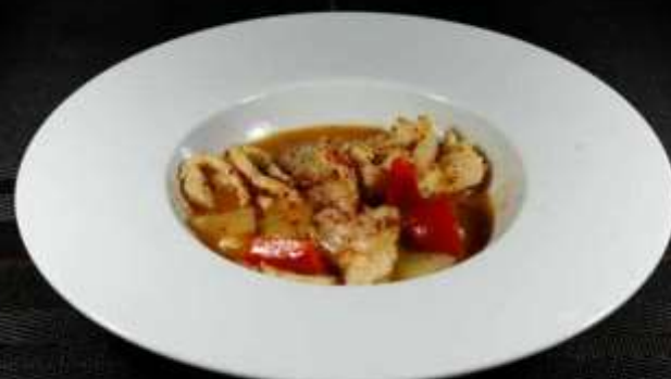
177 POLLO IN SALSA SATE' ❄️