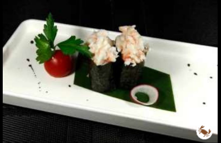
62 GUNKAN GAMBERI COTTI ❄️