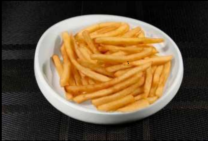
163 PATATINE FRITTE 🌿