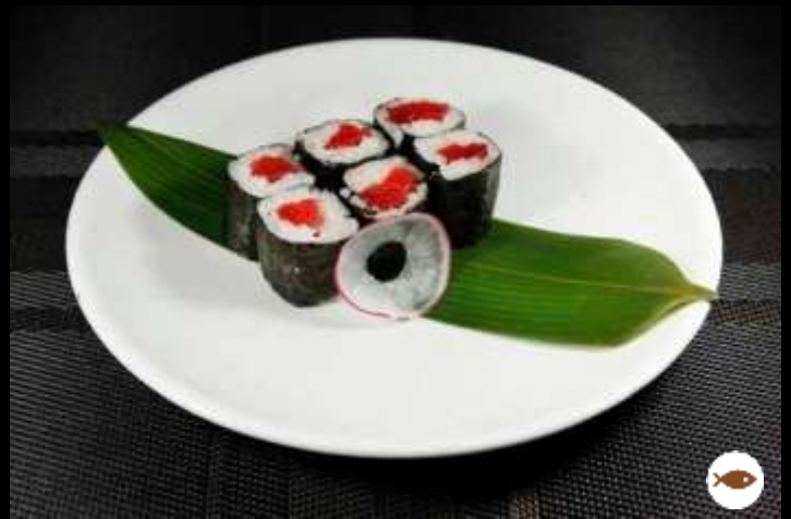
25 HOSOMAKI TONNO