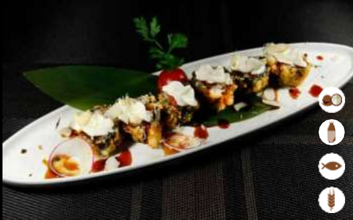
30 HOSOMAKI FRITTO € 6,00 salmon, philadelphia, scaglie di mandorle e teriyaki