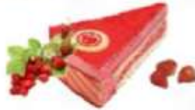
Torta del Drago alle Fragoline