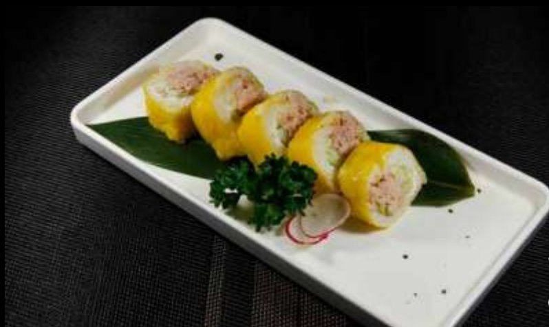
126 FUTO CAMALEON

philadelphia, salmon, avocado e salsa teriyaki