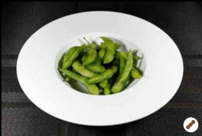
05 EDAMAME 🌿 fagioli di soia giapponese