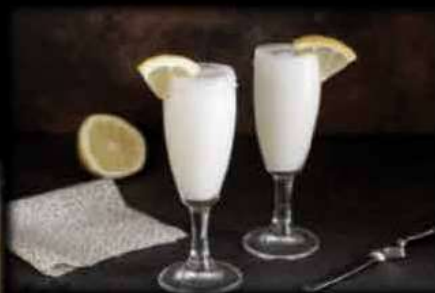
Sorbetto al limone €5,00