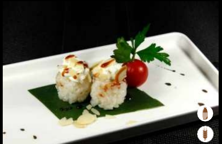
64 GUNKAN WHITE