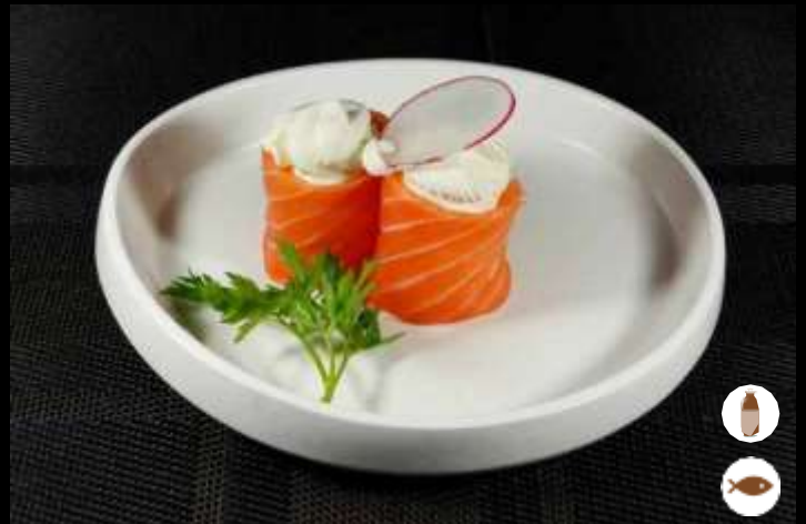
68 GUNKAN OUT SALMONE PHILADELPHIA € 4,50