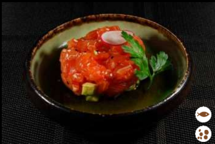
77 TARTARE SALMONE