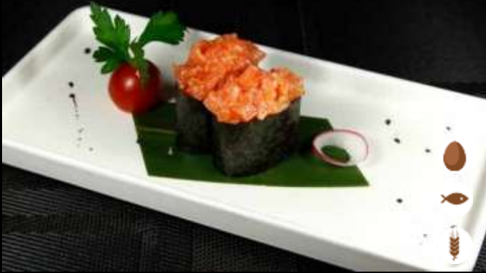
59 GUNKAN SPICY SALMONE 🌶️