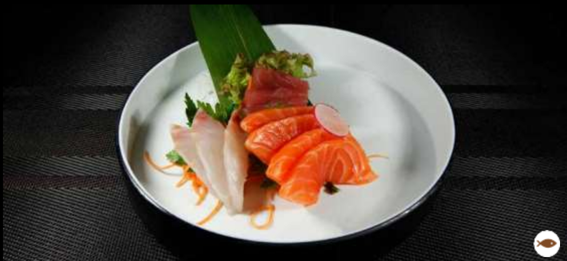
75 SASHIMI MIX 10 pz ordinabile 1 volta