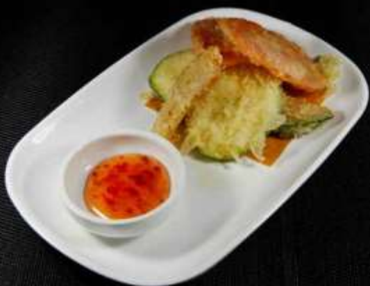
157 TEMPURA ISE 🌿 verdure miste