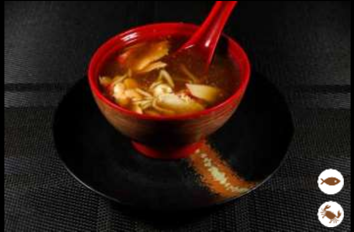
128 YAKI SOUP