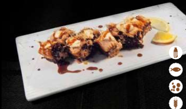
106 URA BLACK SALMONE SCOTTATO € 8,50 riso venere, salmone cotto, philadelphia, teriyaki e kataifi