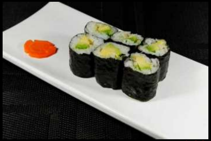
27 HOSOMAKI AVOCADO