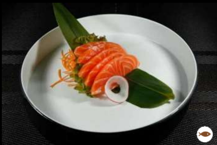
73 SASHIMI SALMONE 5pz ordinabile 1 volta