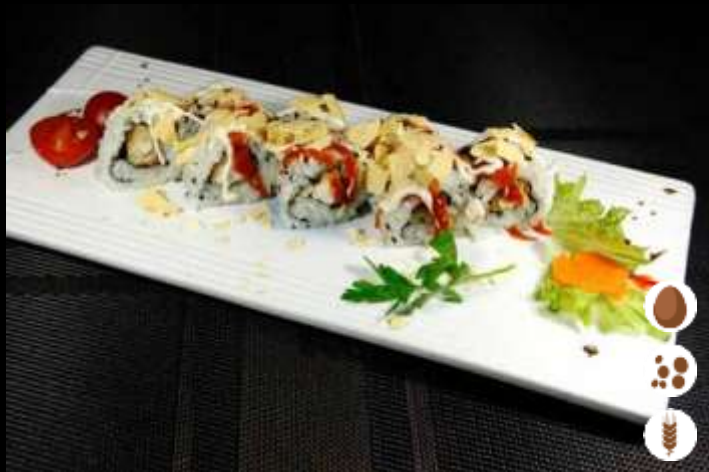
101 URA AMERICA € 7,50 pollo fritto, patatine, maionese e ketchup