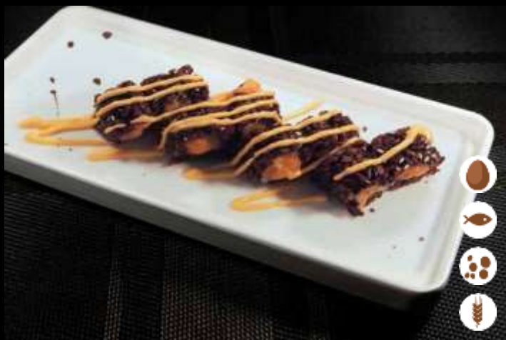
105 URA BLACK SPICY SALMONE 🌶️ € 8,00 riso venere, salmone, maionese piccante