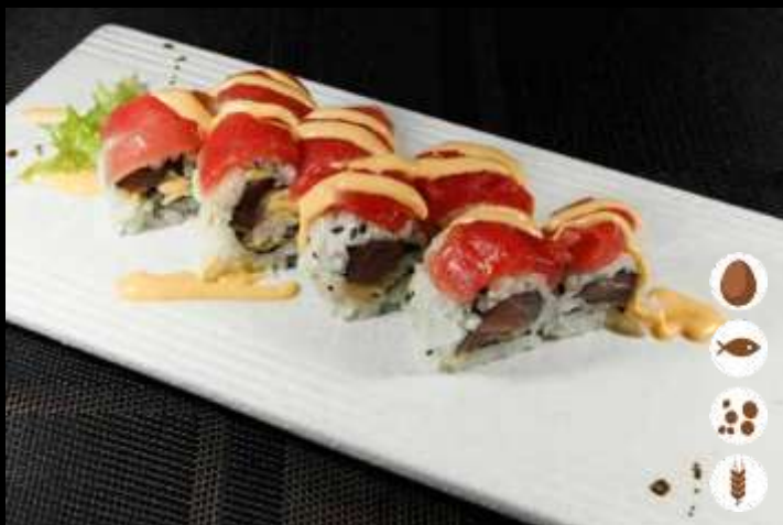
115 URA SPICY TUNA ROLL € 10,00 tartare di tonno e maionese piccante