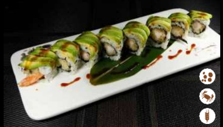
112 URA DRAGON ROLL € 10,00 tempura di gamberi, avocado e teriyaki