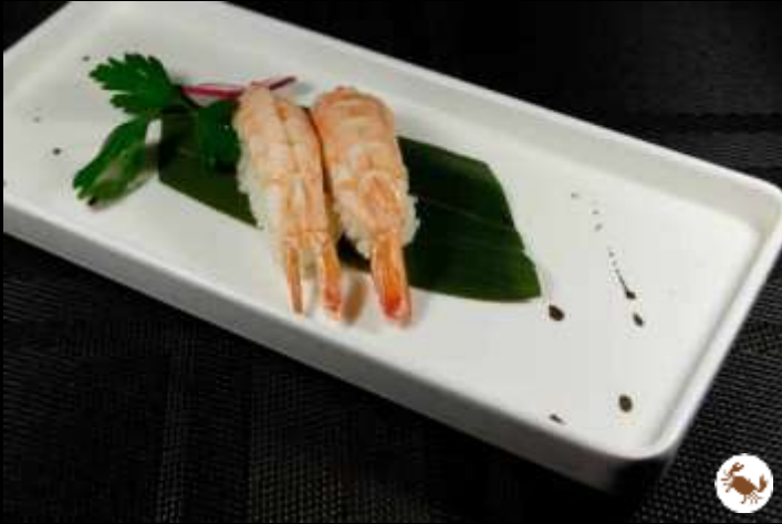
55 NIGIRI GAMBERO COTTO ❄️