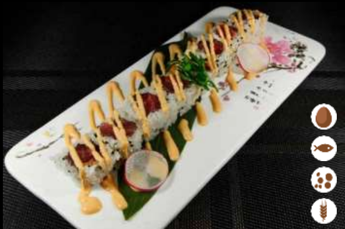
100 URA SPICY TONNO 🌶️ € 8,50 tonno, maionese piccante