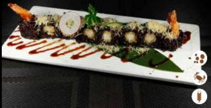
104 URA EBITEN BLACK ❄️ € 7,50 riso venere, gamberi in tempura, salsa teriyaki e kataifi