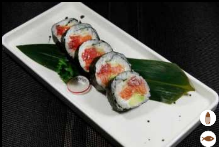
124 FUTO YAKI

salmon, insalata, avocado, cetrioli, philadelphia e aga di tofu