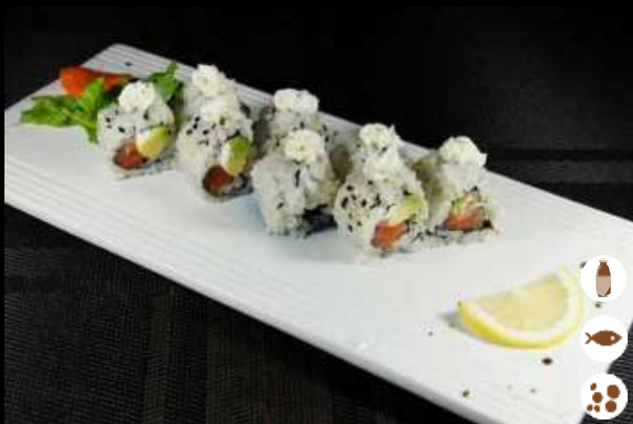
94 URA FEVER

gamberoni in tempura, teriyaki e kataifi