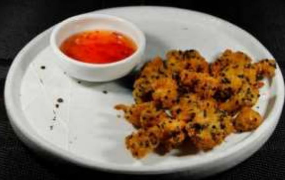
161 POLLO FRITTO 🍗