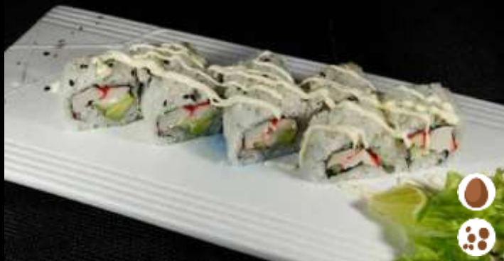
97 URA CALIFORNIA ❄️ € 6,00 surimi di granchio, cetriolo, avocado e maionese