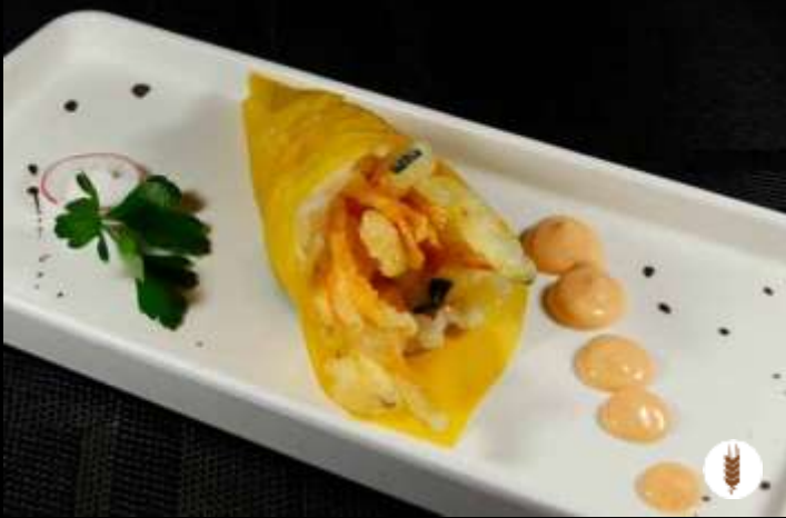
45 TEMAKI GREEN 🌿