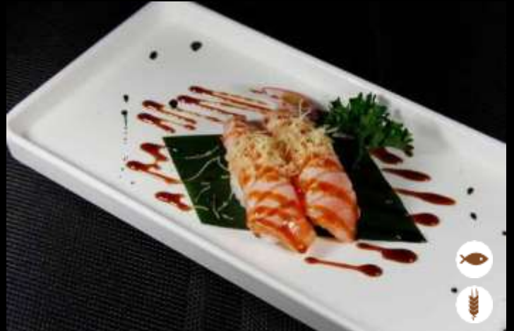
48 NIGIRI SALMONE SCOTTATO 🐟