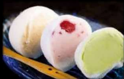
Mochi gelato (3pz) €7,00