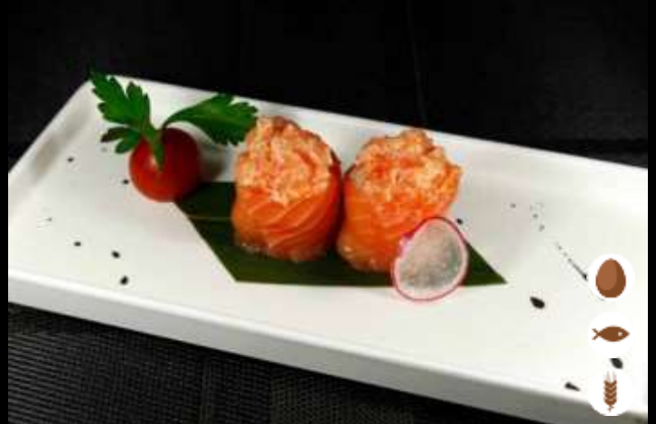
66 GUNKAN OUT SPICY SALMONE € 5,00