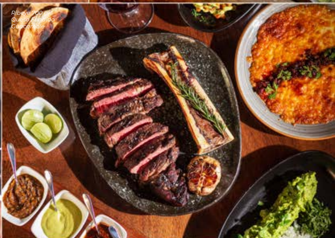
Ribeye 700 gr Queso Fundido Guacamole