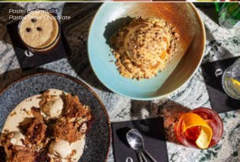
Pastel de Carajillo Pastel Triple Chocolate