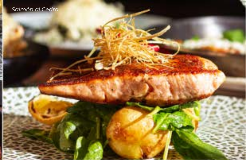
Salmón al Cedro