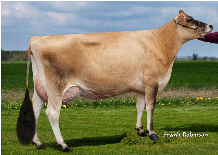
Madre: Jx Sexing Lemonhead 59789 747