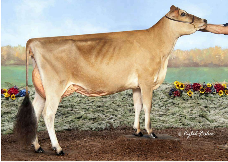
Madre: River Valley Citation Lovely-ET EX-90

Padre: River Valley Cece Chrome-ET JNSC Madre: River Valley Citation Lovely-VG-89 Abuelo: Bw Citation A-ET BB Abuela: Goldust Karbala Laina-ET VG-89