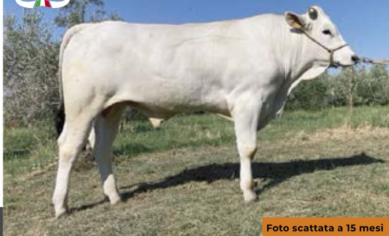
Foto scattata a 15 mesi