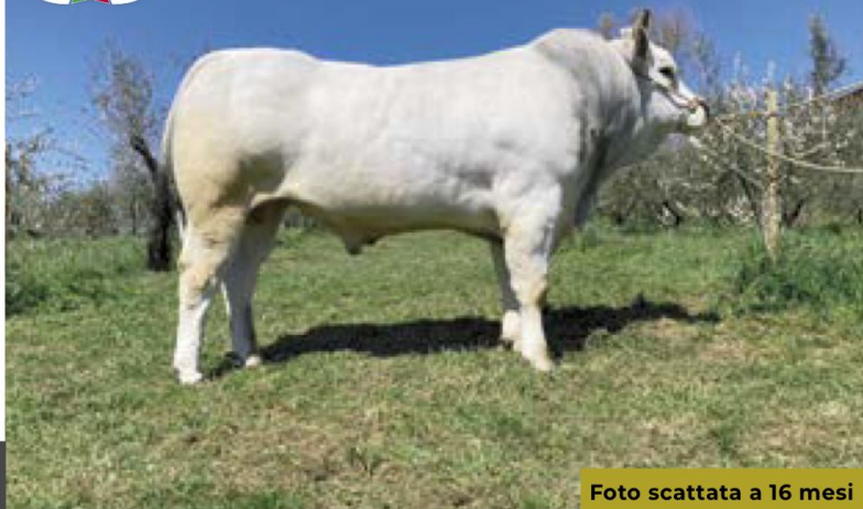
Foto scattata a 16 mesi

PADRE / SIRE FACEBOOK P.ti 86 IT062990185896