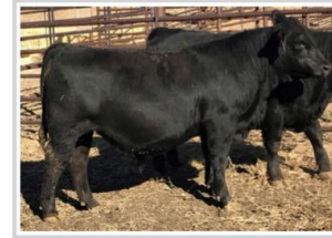
Son: Sitz Response