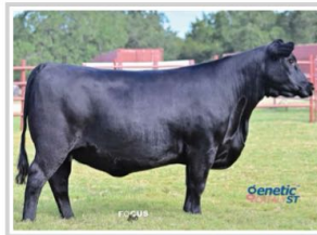
Madre: HR Rita 9068