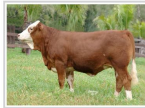
Daughter: Fauna da Zurita

Tattoo: BHR 567J Nacido: 4/8/1999 Birth Wt: lbs