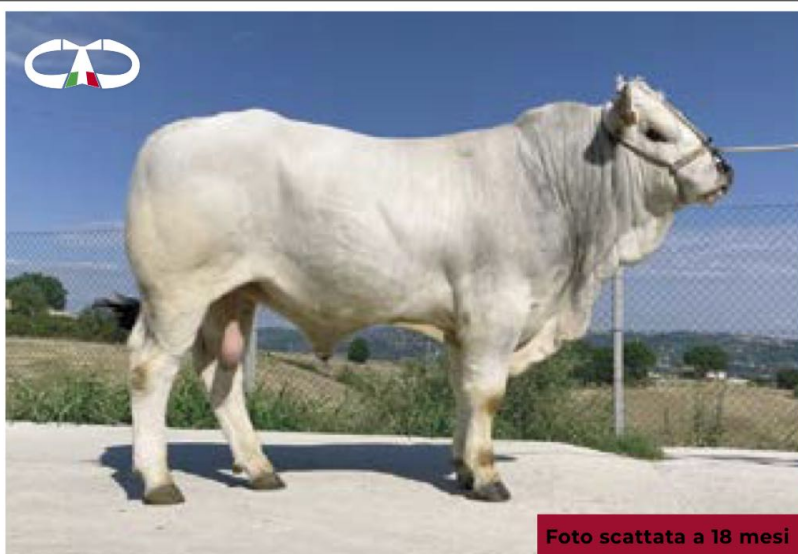
Foto scattata a 18 mesi