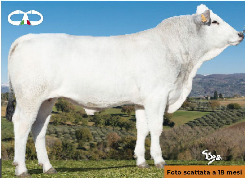
Foto scattata a 18 mesi