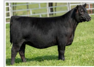
Daughter: Sankey Angus, IN