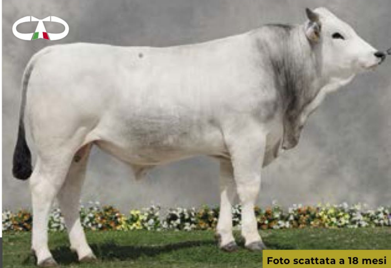
Foto scattata a 18 mesi

PADRE / SIRE TIRO P.ti 85 IT068990019437