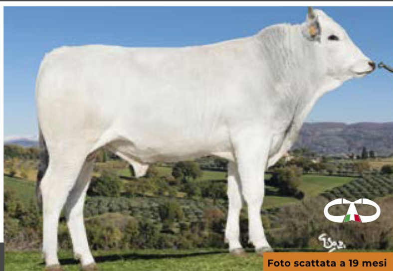
Foto scattata a 19 mesi