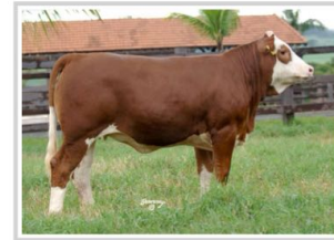
Daughter: Flora da Zurita