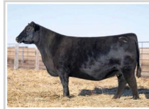
Madre: Black Cathy of Conanga 8521

From: Connealy Angus, NE and Select Sires, Inc., OH