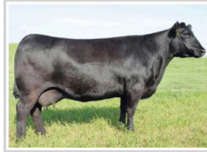
Paternal Granddam: SAV Blackcap May 4136

From: Sitz Angus Ranch, MT; KG Ranch, MT and Hilltop Angus, MT