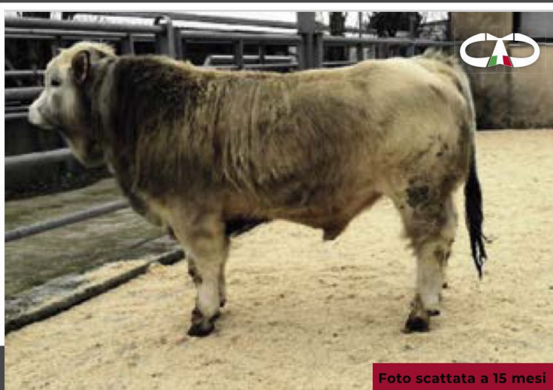
Foto scattata a 15 mesi