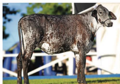
Filha de SUPREMO: 3091 SUPREMO JCRF

SUPREMO está em Teste de Progenie, com previsão de resultado para 2032.