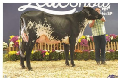
Irmã própria: Ninfeta FIV Mccutchen Delib