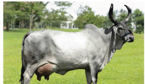
Mãe do Rei: Jarina JBP

REI é filho de Jarina JBP, matriz duplo propósito provada com produção média diária de 36,51 kg de leite (ExpoGoiânia 2013), peso oficial superior aos 800 kg e detentora do Certificado Especial de Produção Leiteira - ABCZ 2017 com produção acumulada de 12.476 kg de leite.