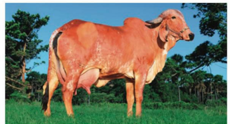
Mãe do FLAMENGO: Jiba FIV de Brasília (RRP 6875)

FLAMENGO está em Teste de Progênie, com previsão de resultado para 2028.