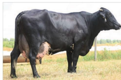
Mãe do Bronze: Hilux Lineman FIV IS Olhos D'água

BRONZE está em Teste de Progênie, com previsão de resultado para 2031.