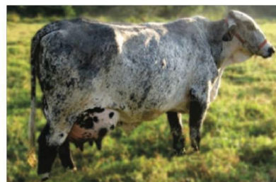
Mãe do ESTALONE: Zumira 982 WTF da Estiva

Filho de Zumira WTF da Estiva, vaca CCG ¼ muito renomada, que possui uma lactação de 12.678,29 kg de Leite. Foi recordista por vários anos consecutivos de produção de leite dentro de sua categoria. Zumira possui muitas filhas destaques no Sumário de Fêmeas da Associação Girolando.