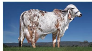
Mãe do DOMINANTE: Ovação FIV de Brasília (RRP 7895-15)

DOMINANTE está em Teste de Progênie, com previsão de resultado para 2029.