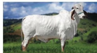
Filha do DOMINANTE: Gleba FIV 2B