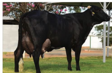
Mãe do LITIO: Quelinha Everett FIV 2B

LITIO está em Teste de Progênie, com previsão de resultado para 2030.