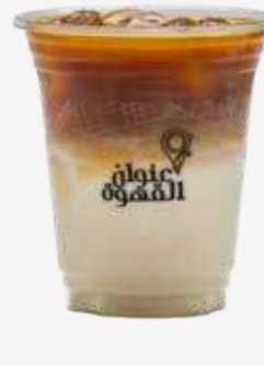
ايس كورتادو Ice Cortado