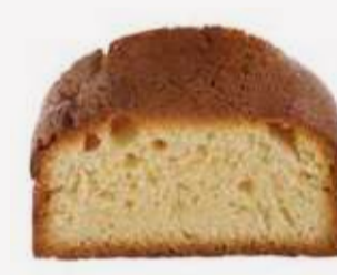
انجلس كيك فانيليا English Cake Vanilla