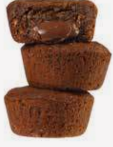
تشوكليت كب كوكيز Chocolate Cookies