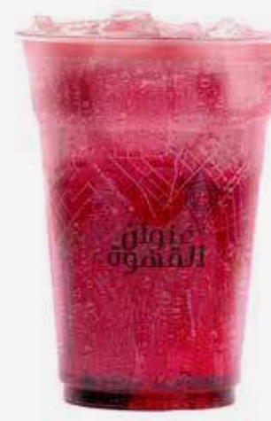
موهيتو بلوبيري Blueberry