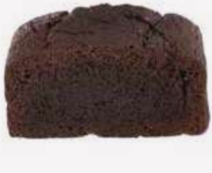
انجلس كيك تشوكليت English Cake Chocolate