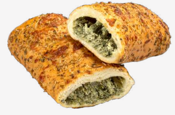
بريتزل جبنة بالسبانخ Cream Cheese Pretzel with Spinach