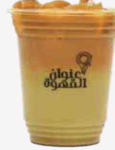
ايس بستاشيو كورتادو Ice Pistachio Cortado