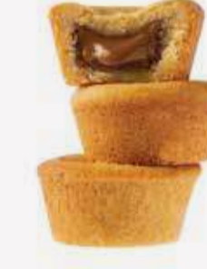
نوتيللا تشوكليت كوكيز Nutella Cookies