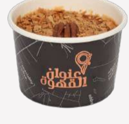
بودينق التمر Dates Pudding