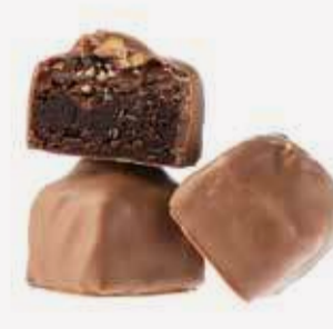
براوني سولتد كراميل Salted Caramel