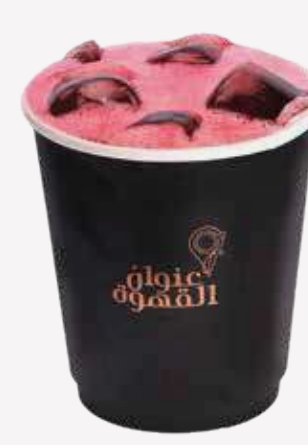
ايس كركديه Ice Karkade