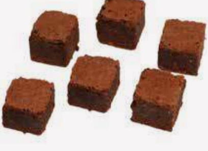
براوني بايتس Brownie Bites