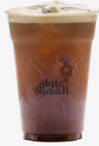
ايس أمريكانو Americano