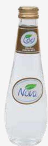
مياه فوارة Sparkling Water