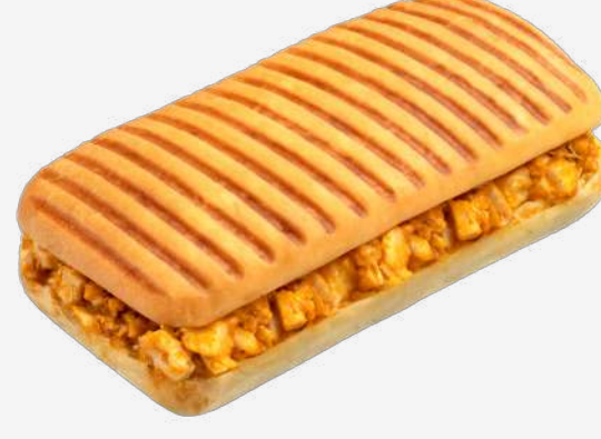
باتيني دجاج بالسيراتشا Chicken Panini with Sriracha