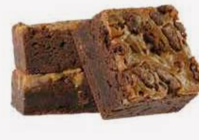
براوني فول سوداني Brownie Penaut