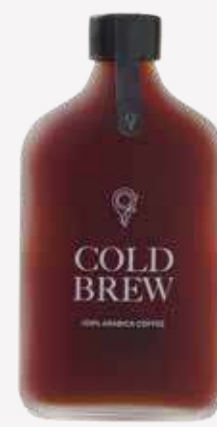
كولد برو Cold Brew