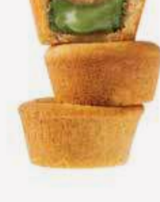
بستاشيو كب كوكيز Pistachio Cookies