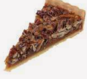
بيكان باي Pecan Pie