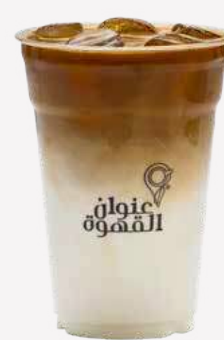
وايت موكا White Mocha