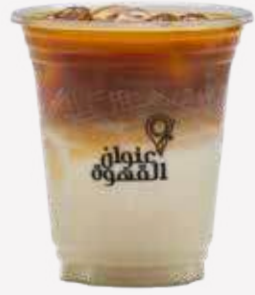
ايس سبانش كورتادو Ice Spanish Cortado