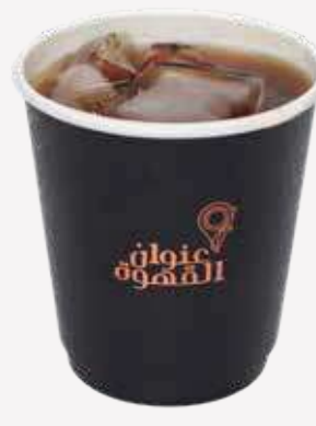
ايس قهوة اليوم ( بلاك ) Ice Coffee of The Day (Black)