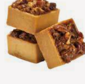
بيكان بايتس Pecan Bites