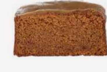
انجلس كيك تمر English Cake Dates