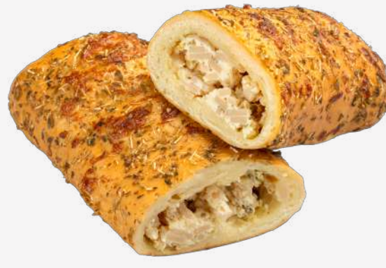
بريتزل ديك رومي بالجبن Turkey Pretzel with Cream Cheese