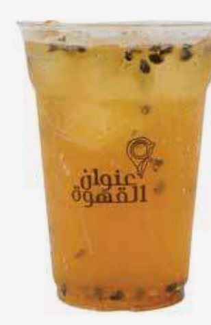
موهيتو باشن تي Passion Tea