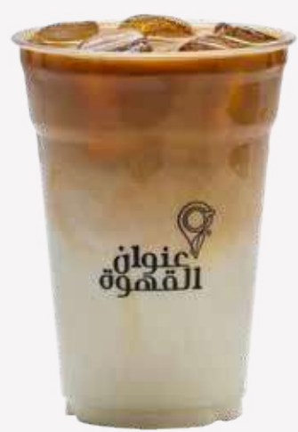
سبانش لاتيه Spanish Latte