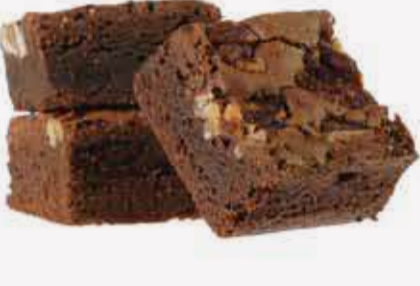
براوني كلاسيك Brownie Classic