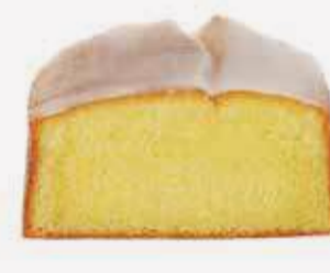
انجلس كيك ليمون English Cake Lemon