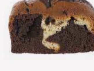
انجلس كيك ماربل English Cake Marble