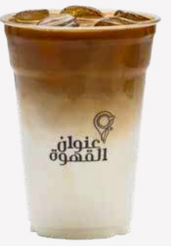
ايس لاتيه Ice Latte