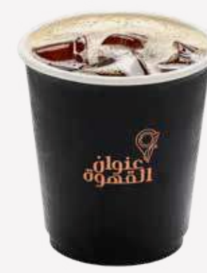
قي 60 V 60

برازيلي 5/7/9/11/14 اثيوبي 8/10/12/14/16