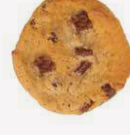
فانيليا كوكيز Vanilla Cookies