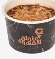
بودينق ميلك تشوكليت Milk Chocolate Pudding