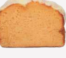
انجلس كيك برتقال English Cake Orange