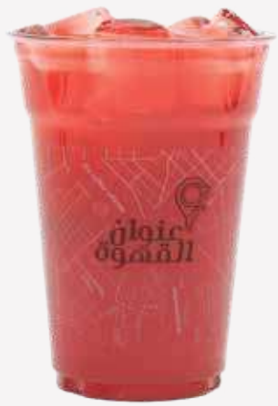
جم يسرسم Ice Watermelon