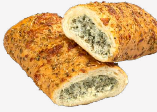
بريتزل جبنة بالنعناع Cream Cheese Pretzel with Mint