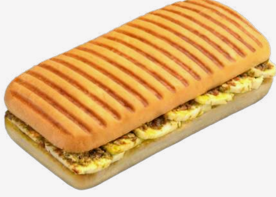
باتيني حلومي بالبيستو Halloumi Panini with Pesto