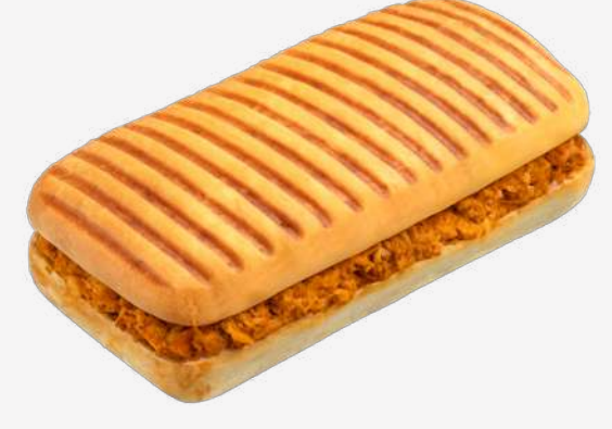
باتيني تونة حارة Spicy Tuna Panini