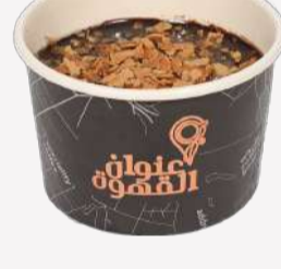
بودينق دارك تشوكليت Dark Chocolate Pudding