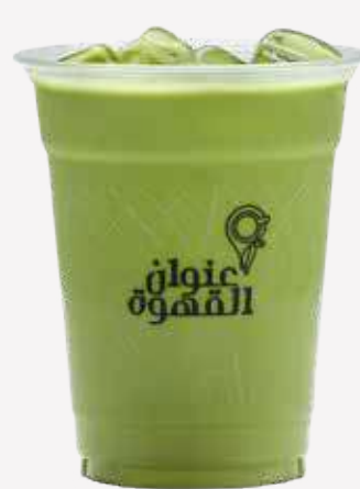
ايس ماتشا Ice Matcha