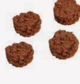
كرنشي تشوكليت Crunchy Chocolate