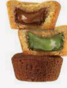
مكس كب كوكيز Mix Cookies