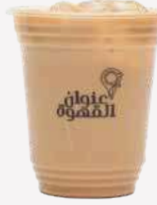
ايس وايت موكا كورتادو Ice White Mocha Cortado